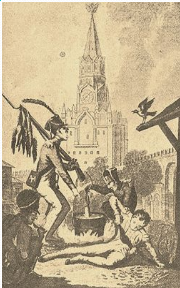
Басня «Ворона и курица»

Воз начал напирать, телега раскатилась: Коня толкает взад, коня кидает вбок; Пустился конь со всех четырех ног