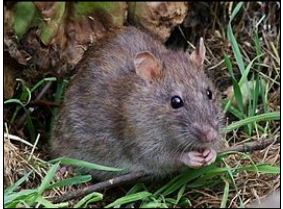
Без крыс в космосе никак