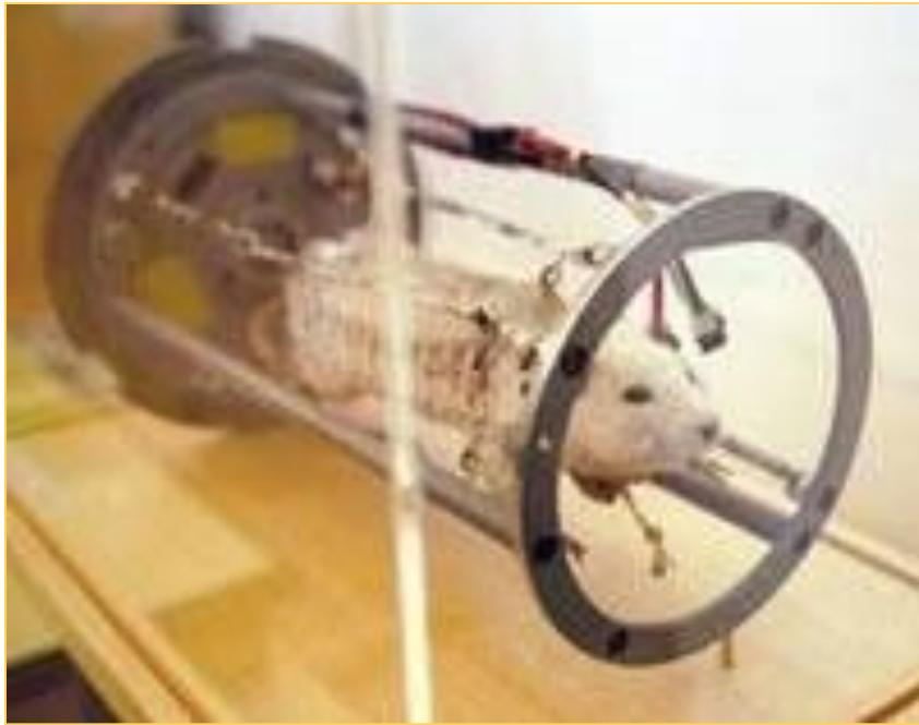
Крыса Гектор в контейнере