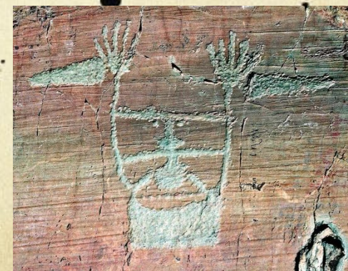
Долина чудес (Франция)