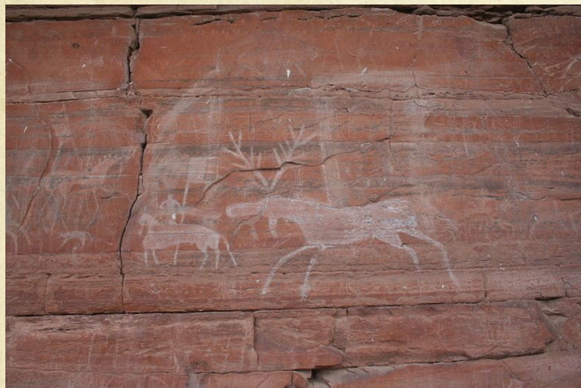
Шишкинские писаницы (на Урале)

Кроме наскальной живописи есть Петроглифы — высеченные изображения на каменной основе (от др.-греч. πέτρος — камень и γλυφή — резьба). Которые имеют самую разную тематику — ритуальную, мемориальную и знаковую.