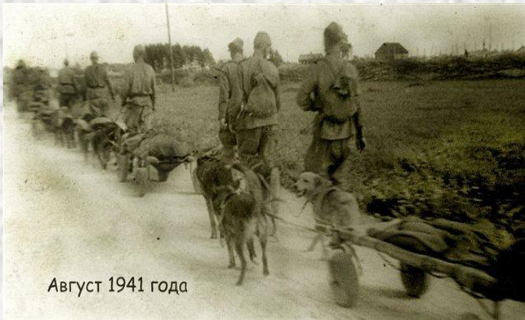
Август 1941 года