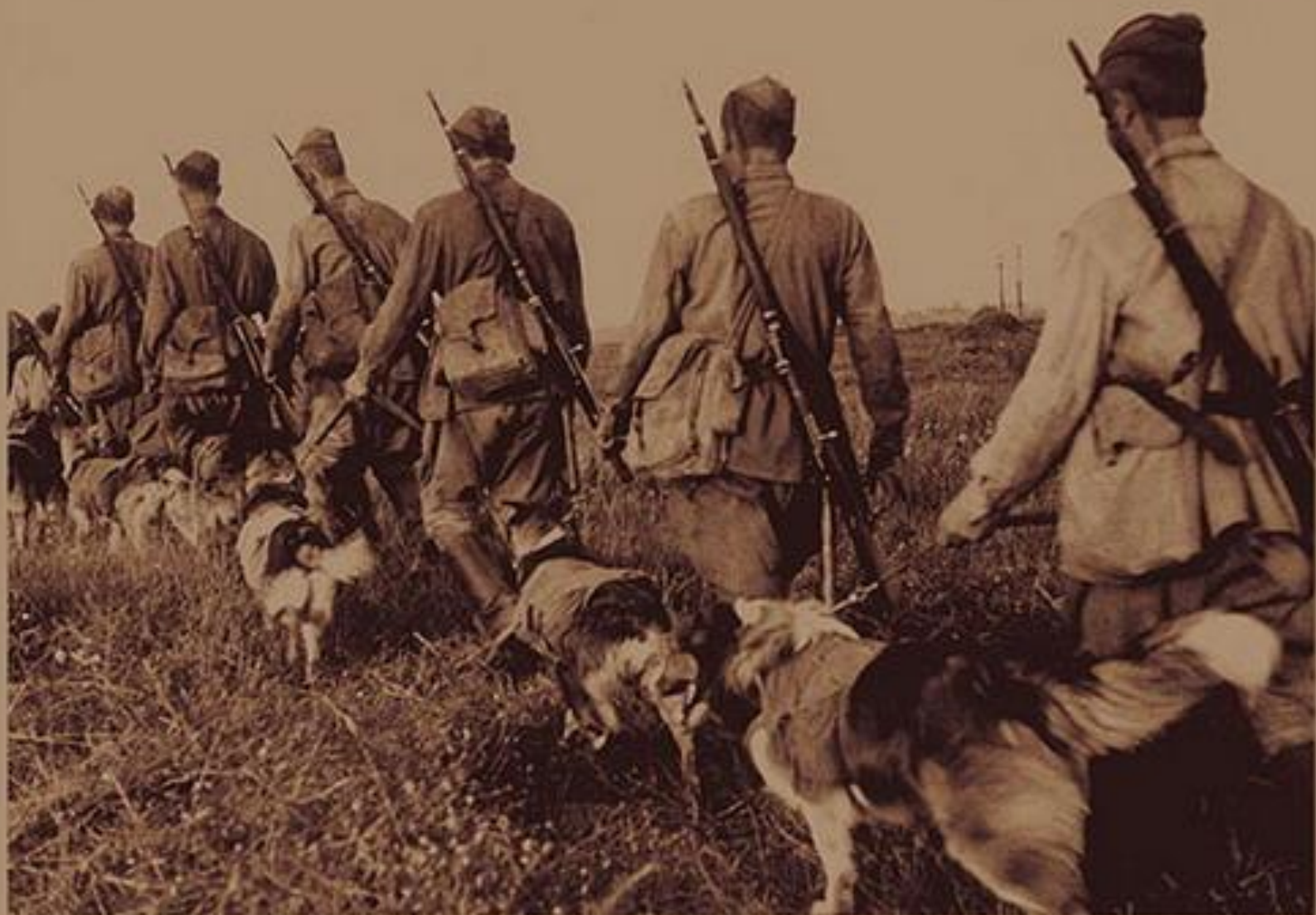
фото 1942 года . Фронтотывые собаки -Бойцы со своими проводниками.