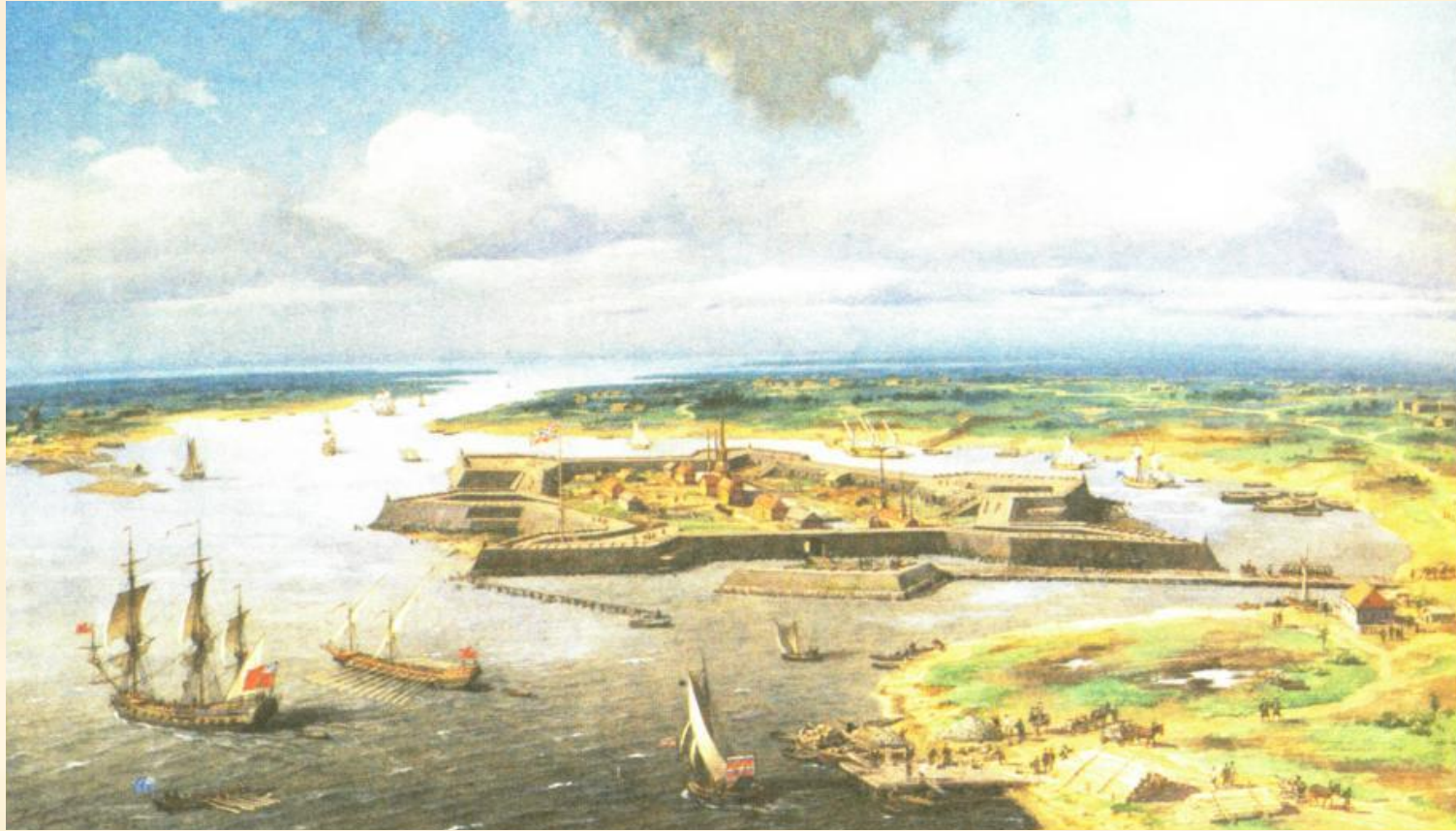
Санкт-Петербург. Первые годы