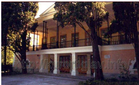
Дом –музей А.С. Пушкина в Гурзуфе