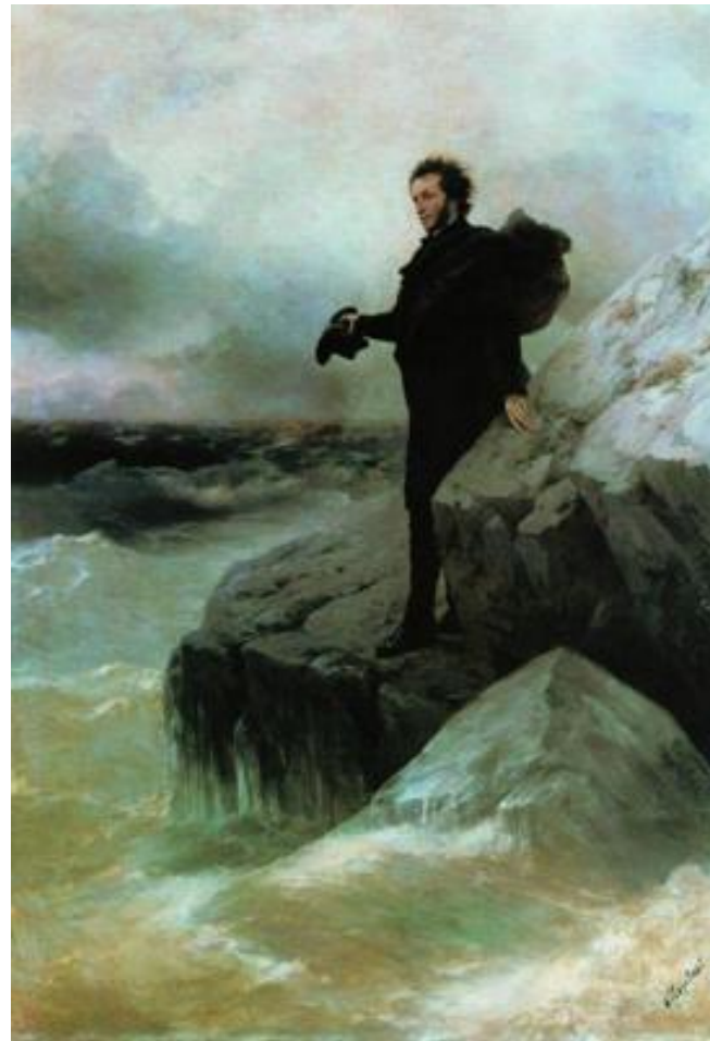
И. Айвазовский Прощание А. С. Пушкина с морем.