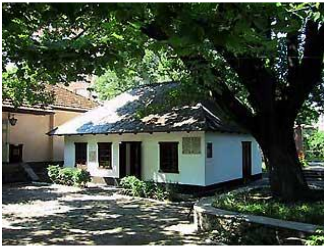
Дом-музей А.С.Пушкина в Кишиневе