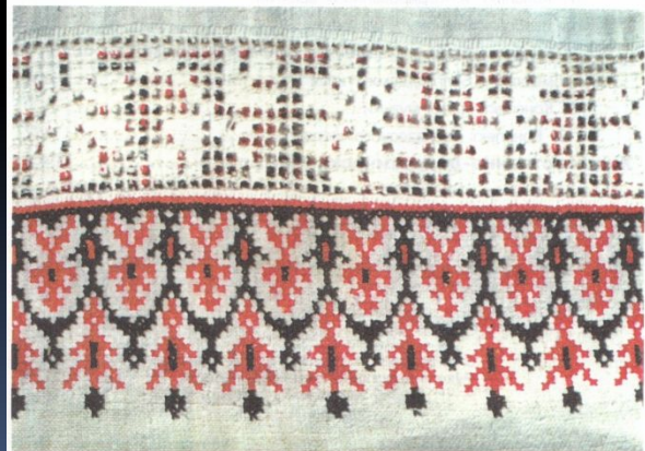
Рождественский рушник. Растительный орнамент. Грайворонский р-н.