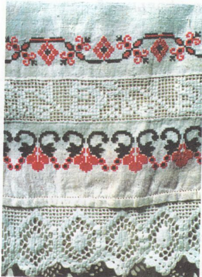
Свадебный рушник. Растительный орнамент. Грайворонский р-н.