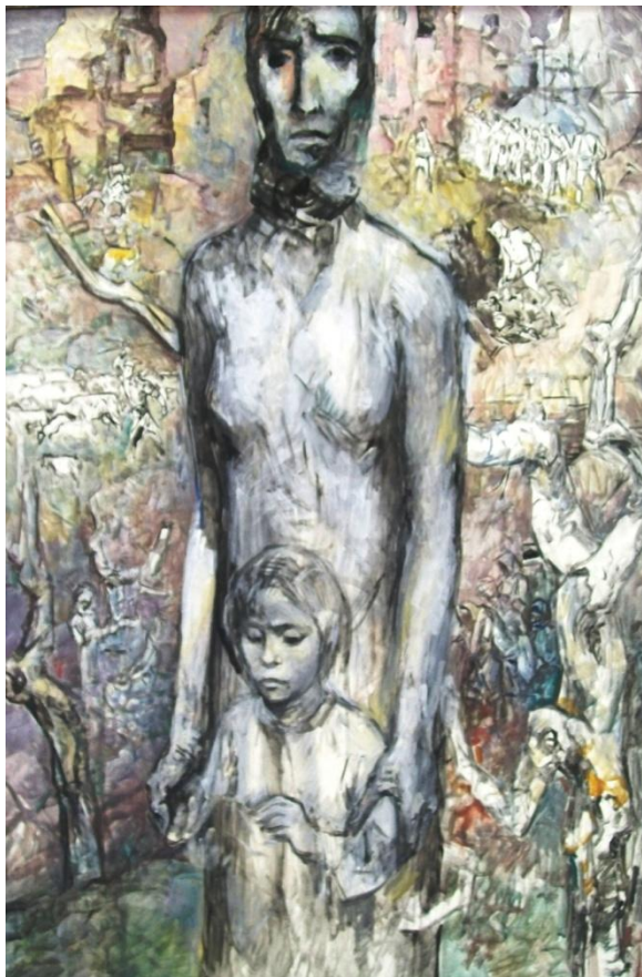
Худ. Николаев Я.С. «На оккупированной территории»