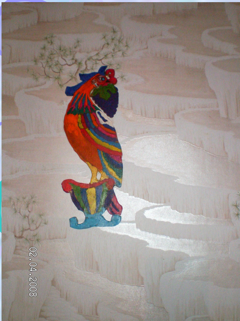
Панно «Жар птица»