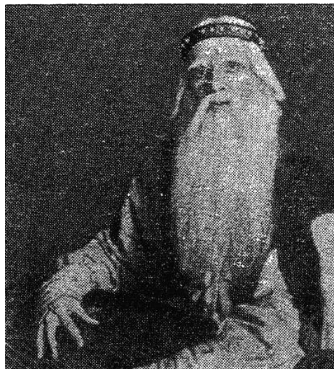
Боян опера «Руслан и Людмила» Глинка