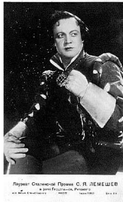
Партия Герцога опера «Риголетто» Верди

Среди многочисленных партий: Берендей опера «Садко» Римского-Корсакова, Звездочёт опера «Золотой петушок» Римского-Корсакова.