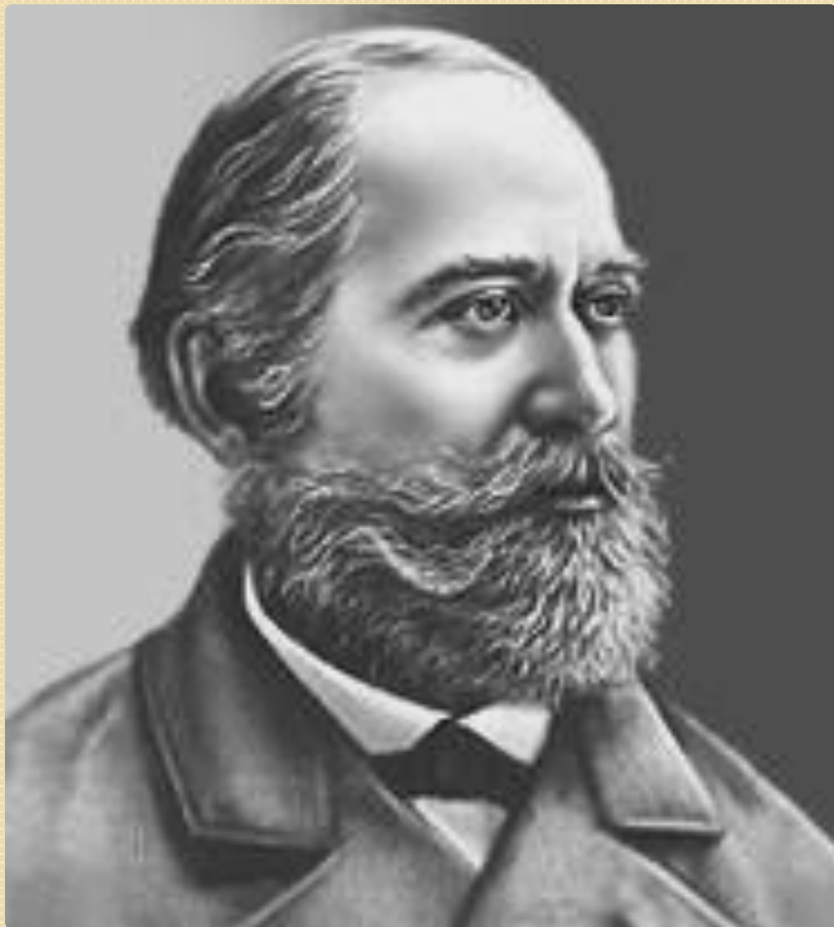
СОЛОВЬЕВ Сергей Михайлович