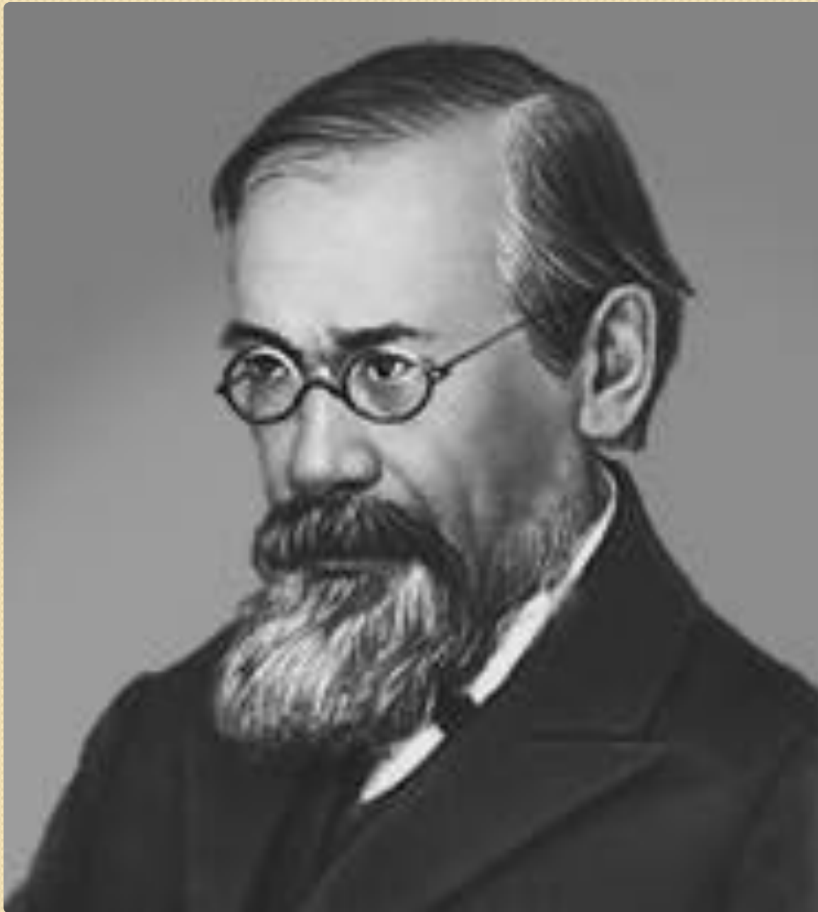
КЛЮЧЕВСКИЙ Василий Осипович