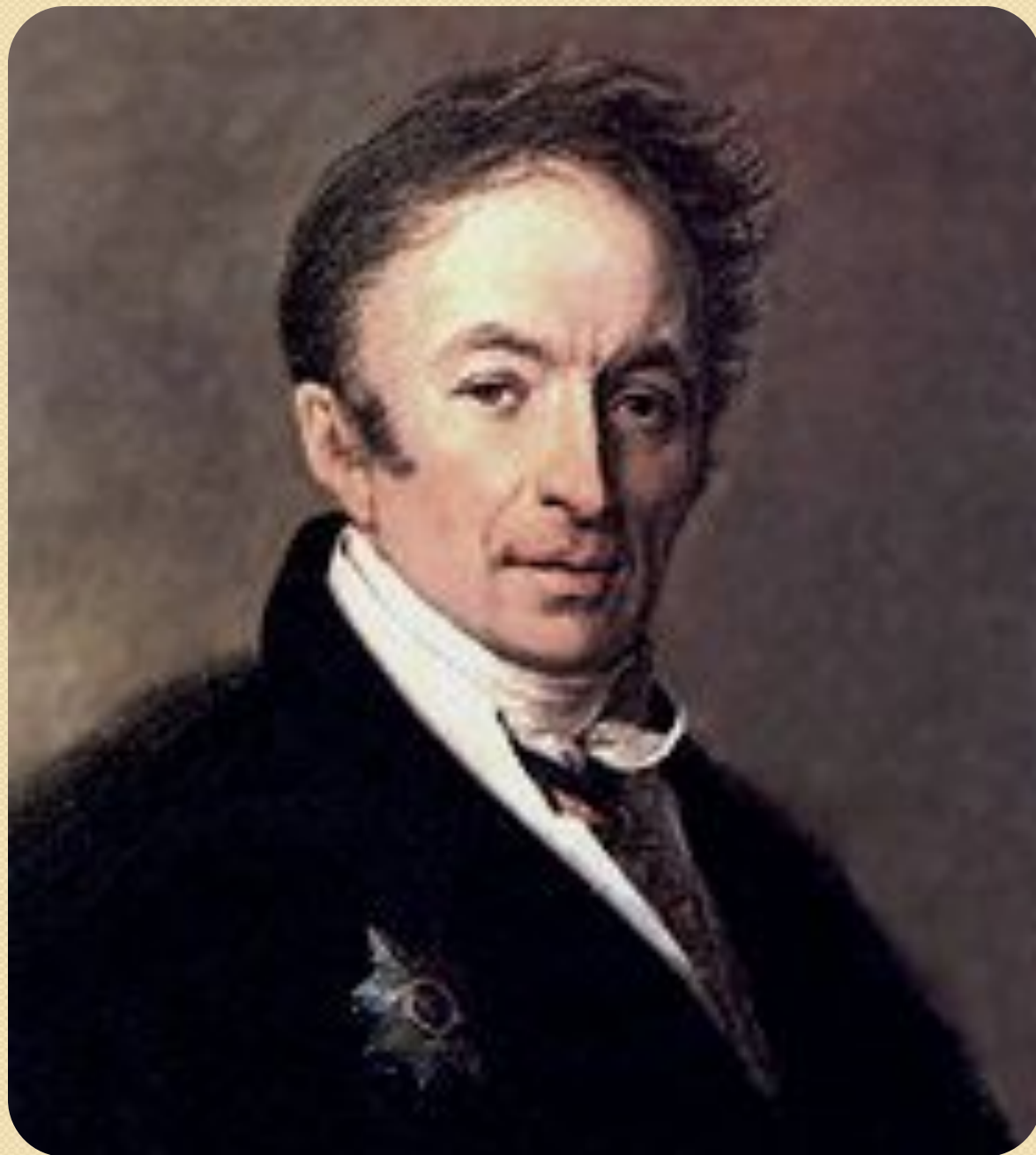
Н. М. Карамзин. Портрет работы А. Г. Венецианова. 1828 г.