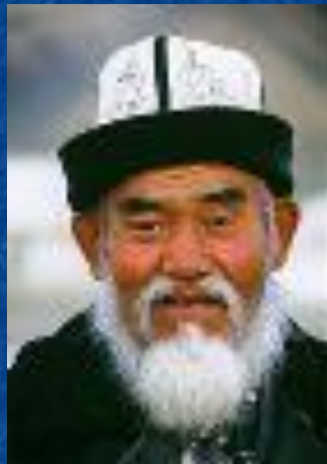
Абдулла, узбекский поэт

Если ты хочешь судьбу переспорить, Если ты ищешь отрады цветник, Если нуждаешься в твёрдой опоре – Выучи русский язык!