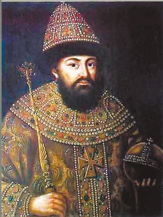
Великий князь московский и всея Руси Иван III Васильевич.

1480 год – освобождение русских земель от ордынской зависимости. Возникновение Московского государства.