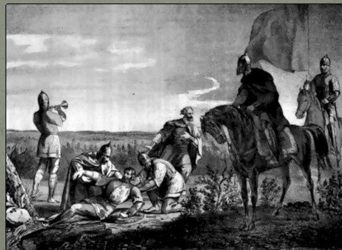
Раненый Дмитрий Донской.