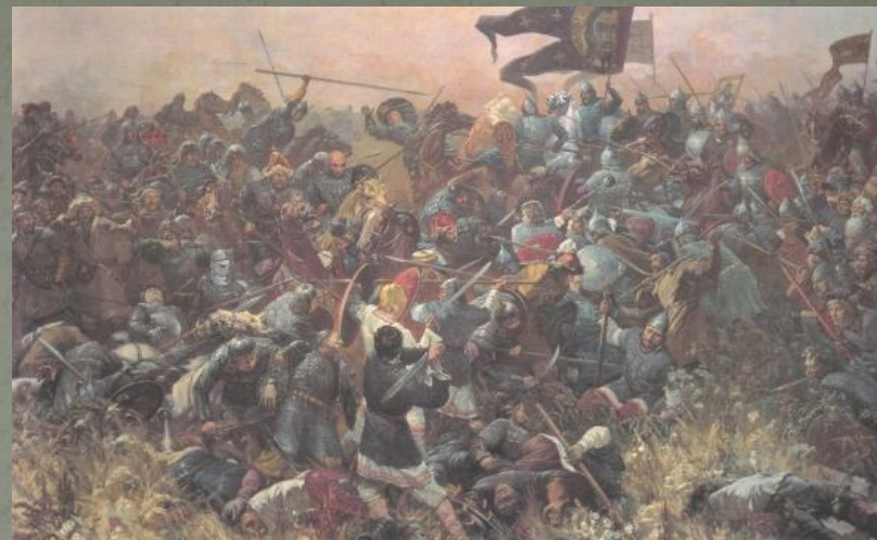
Куликовская битва. худ.Н.Присекин