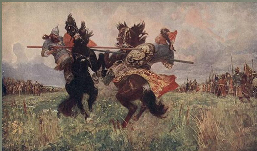
Поединок на Куликовом поле. худ. М.Авилов