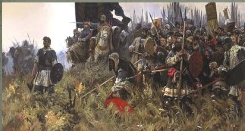
Утро на Куликовом поле. худ. А.Бубнов