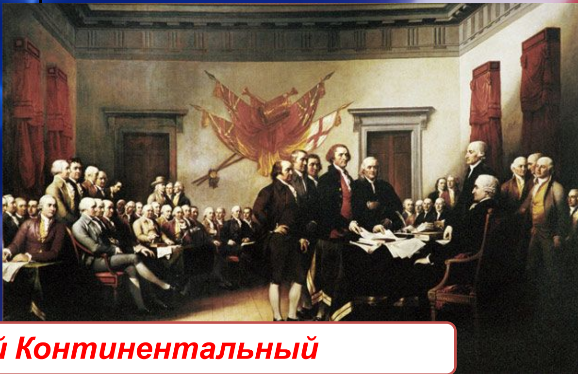
Второй Контиентальный конгресс

10 мая, в Филадельфии собрался Второй Контиентальный конгресс 13 колоний, который с одной стороны подал петицию королю Англии Георгу III о защите от произвола колониальной администрации, а с другой начал мобилизацию вооруженного ополчения, во главе которого стал Джордж Вашингтон. Король охарактеризовал ситуацию в североамериканских колониях как восстание