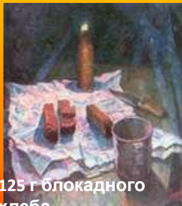
125 г блокадного хлеба