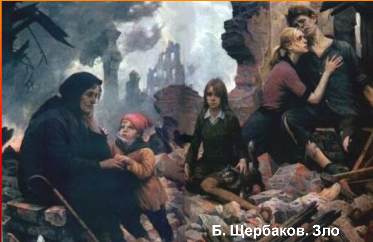
Б. Щербаков. Зло мира.

«Осталась одна пуговица, от маминой кофты. А в печи две булки теплого хлеба».