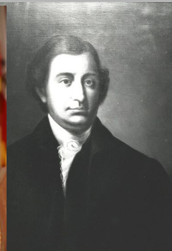
1-й Генеральный прокурор США