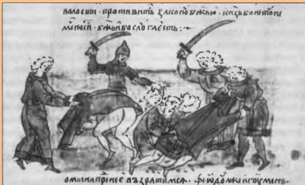
Избиение горожанами Боголюбова посадников, тиунов и мечников Андрея Юрьевича. 1175 г. Миниатюра Радзивилловской летописи

Тиун (тивун) — в Древнерусском государстве — название княжеского или боярского управляющего, управителя. В Великом Княжестве Литовском и в Русском государстве до XVII в. — название некоторых должностей.