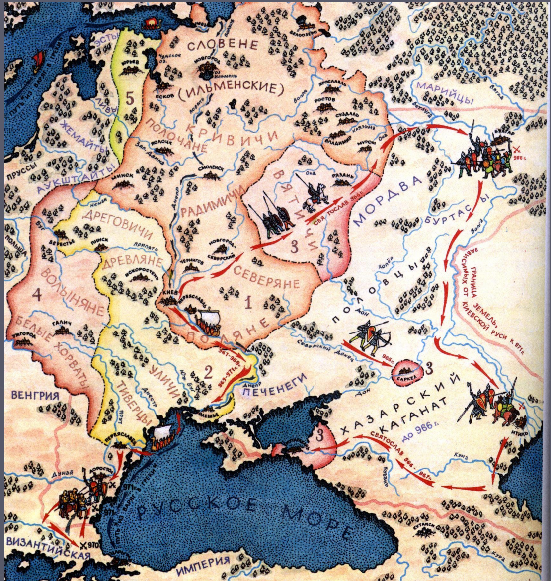
Киевская Русь IX – XI веков.