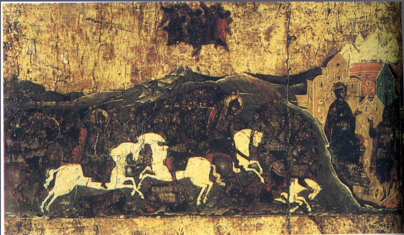
Невская битва 1240 г. Фрагмент старинной иконы