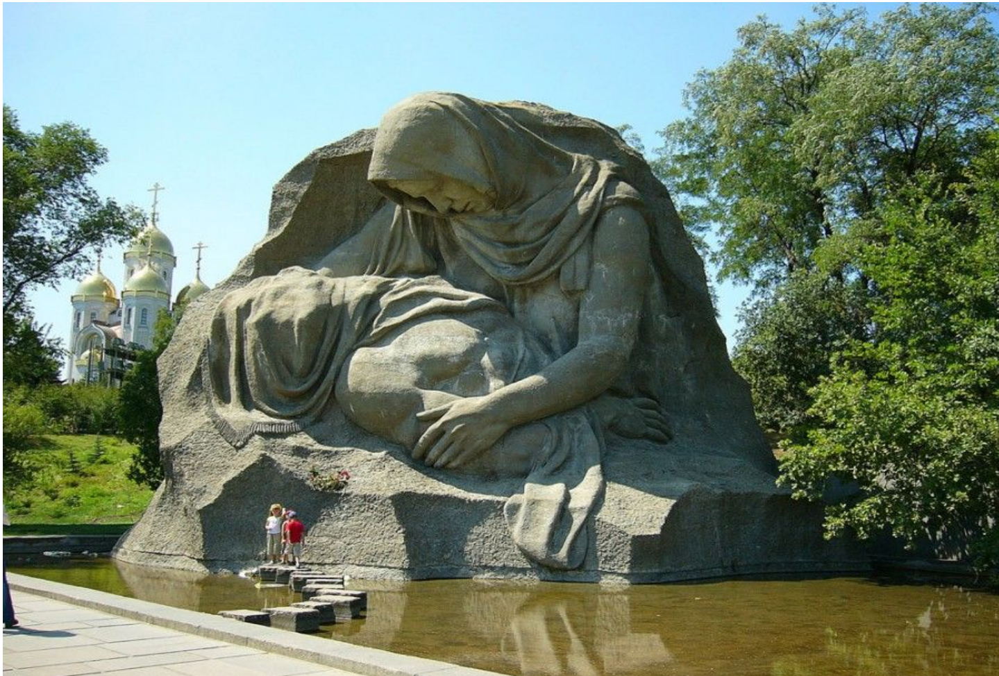
Скульптура «Скорбь матери»