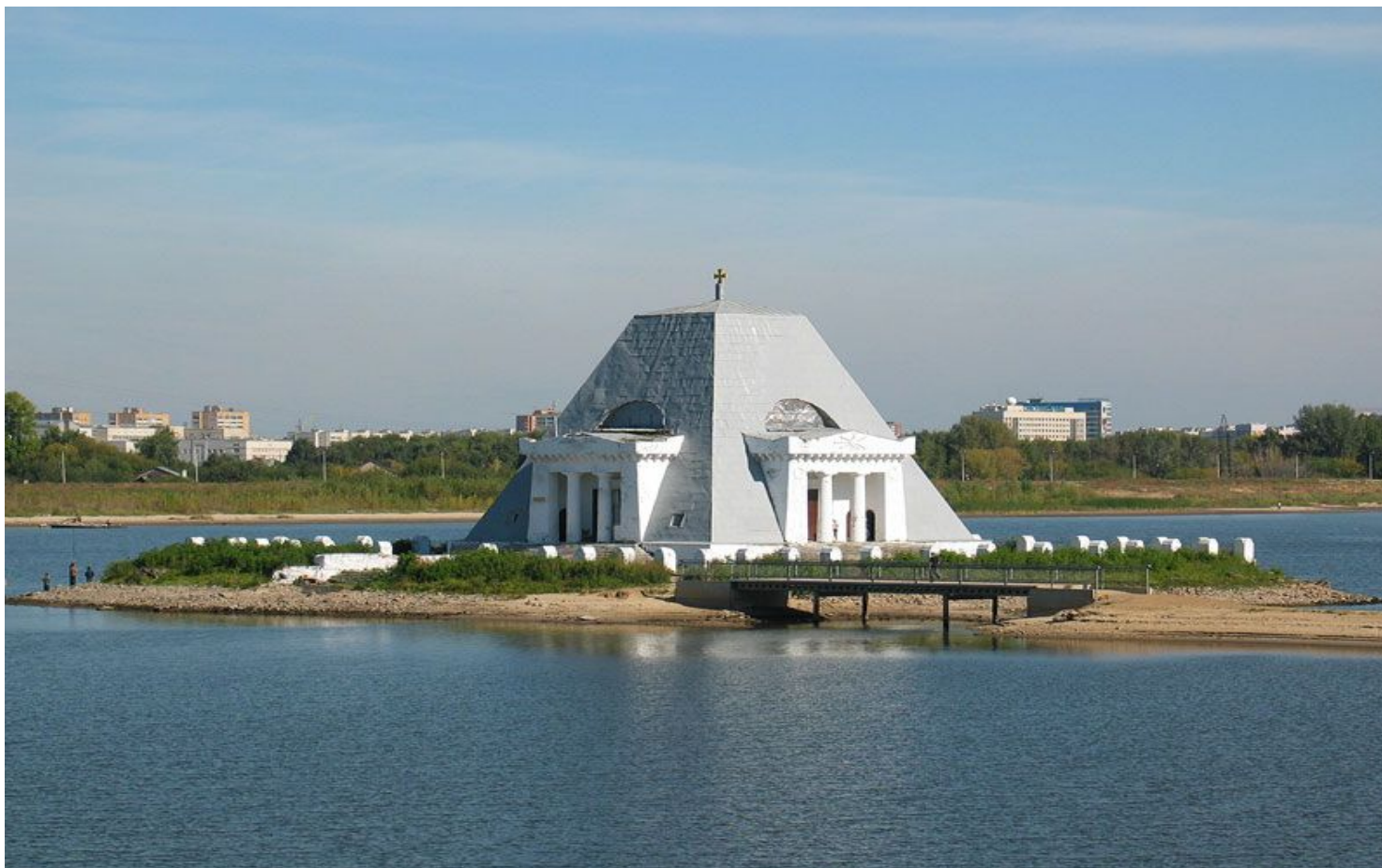
Храм-памятник воинам, павшим при взятии Казани в 1552 г.