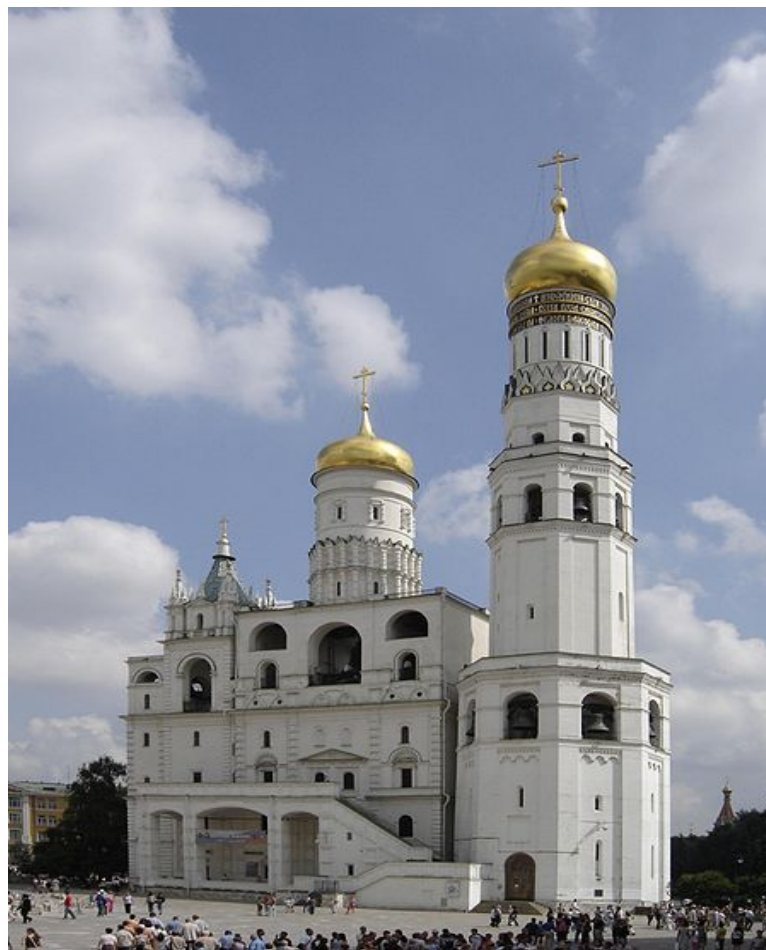
Первая увековеченная в памятнике победа