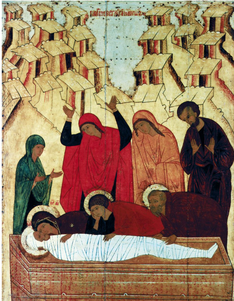
Икона входила в состав праздничного чина из Городца.