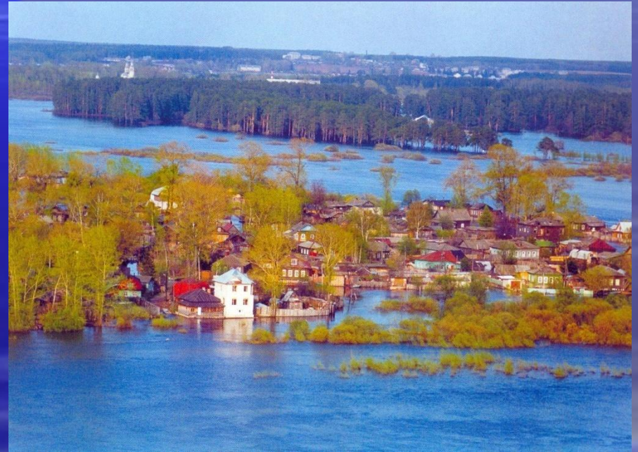
Перед нами затопленное Дымково