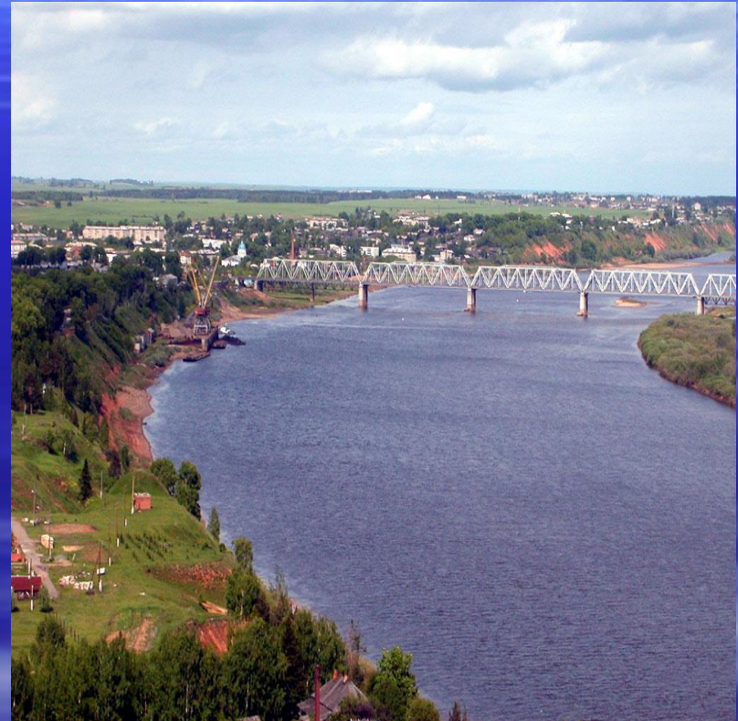
Река Вятка у города Котельнич