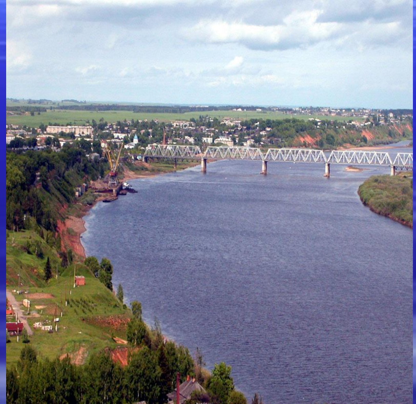
Река Вятка у города Котельнич