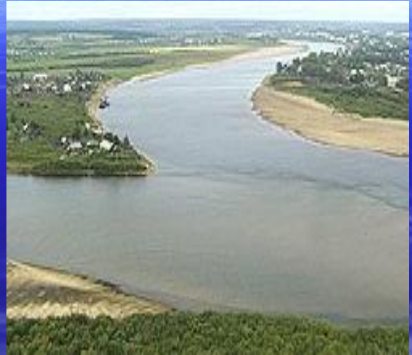
Слияние Юга (на фото слева) и Сухоны