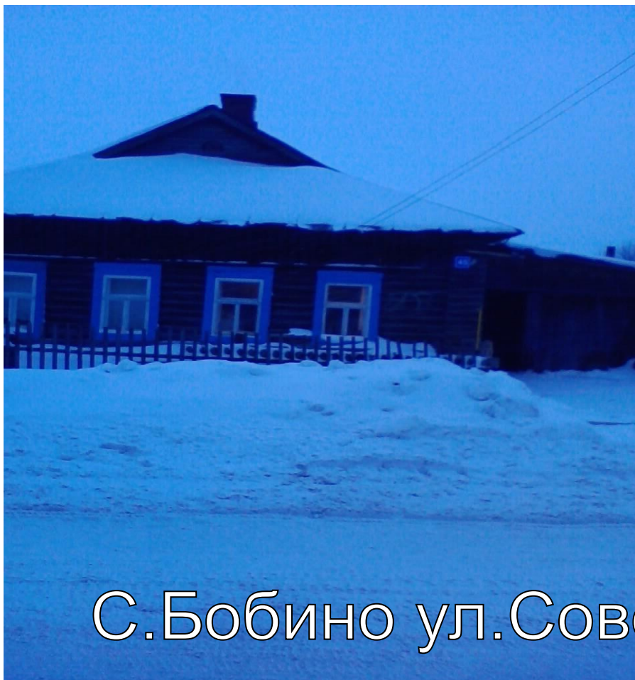
С.Бобино ул.Советская 45