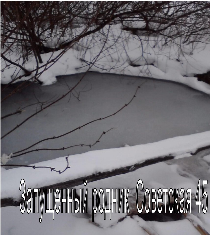
Запущенный родник Советская 45