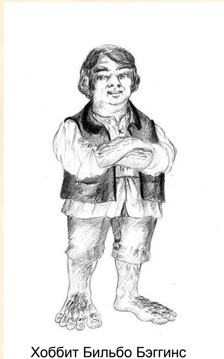
Хоббит Бильбо Бэггинс