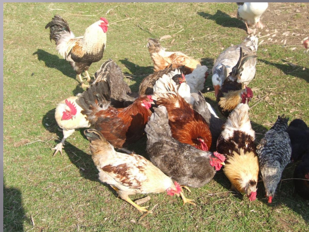
Vistas un gaiļi