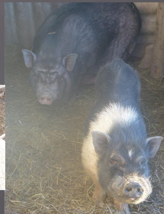
vjetnamas minī cūciņas