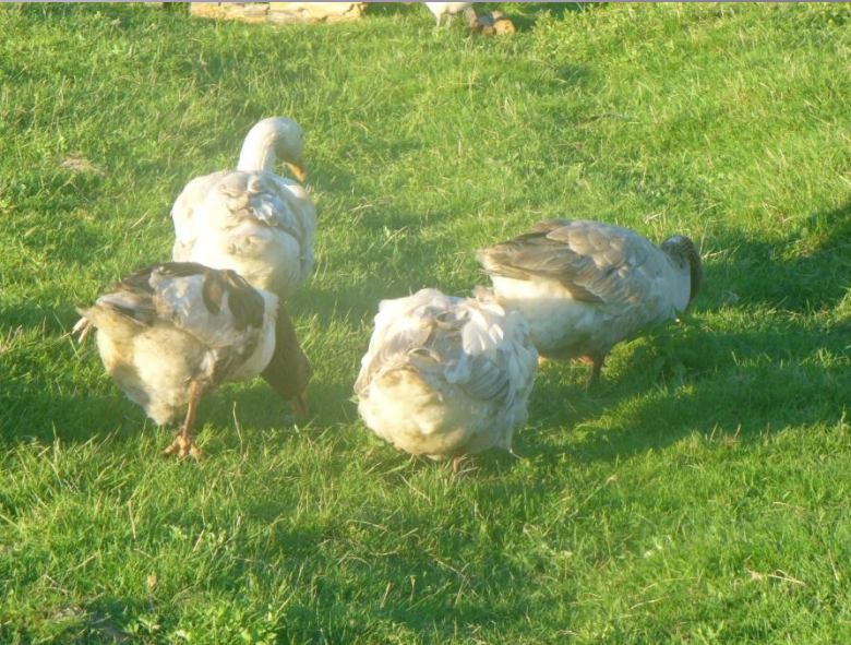
Lenta zosis un parastžās zosis