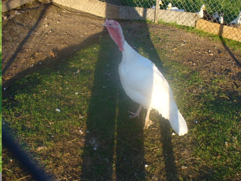
Tītari baltie un pelēkie