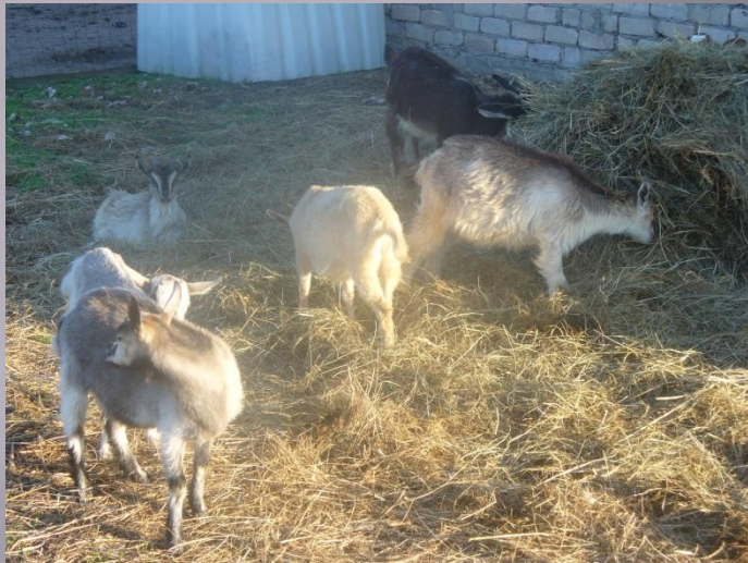
Pundur kazas un āziši