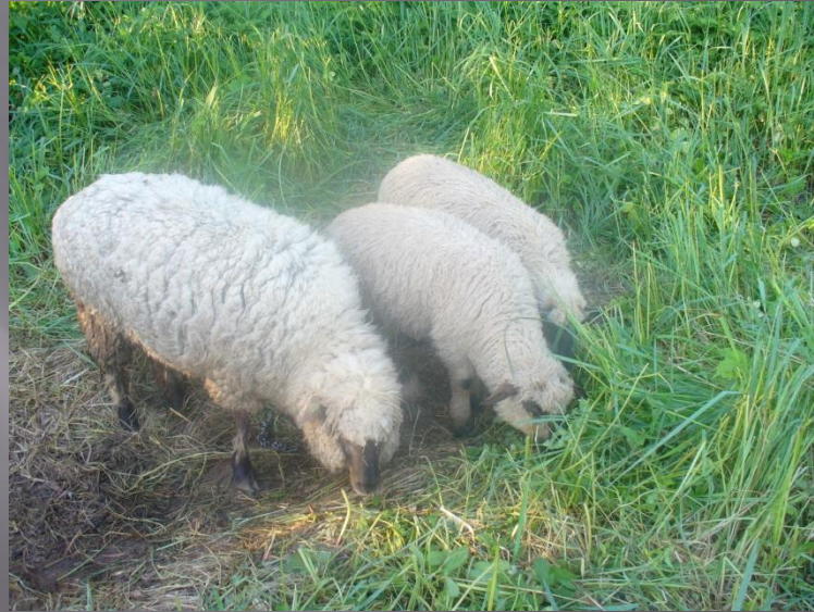
Melgalvaināžs aitas Ramanavskās aitas