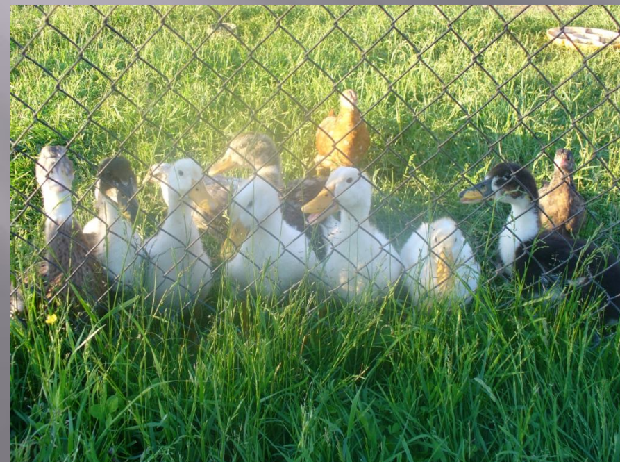
Peķīnas, spoguļpīles, mularda pīles