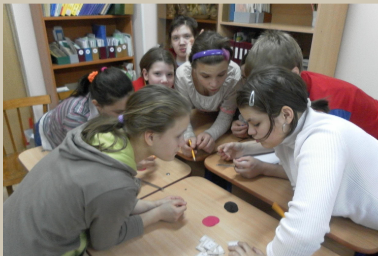
Тест - опросник 1 группа.