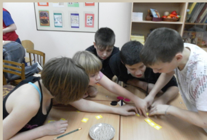
Тест - опросник 2 группа