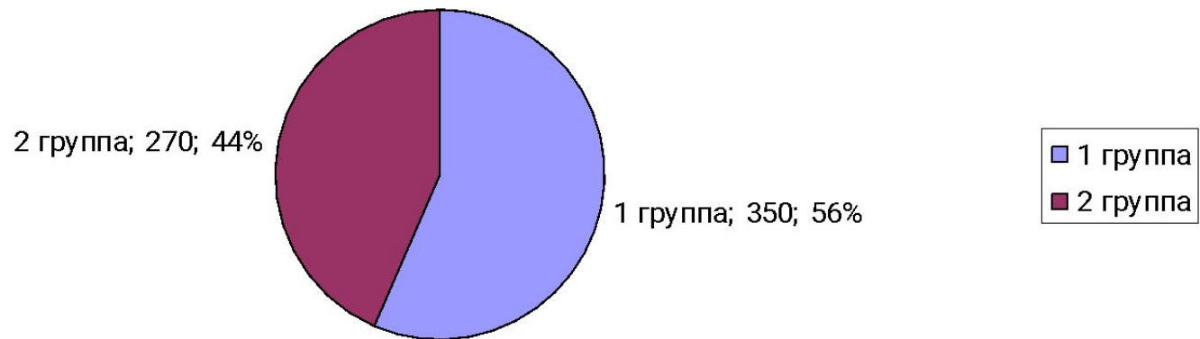
Тест - опросник