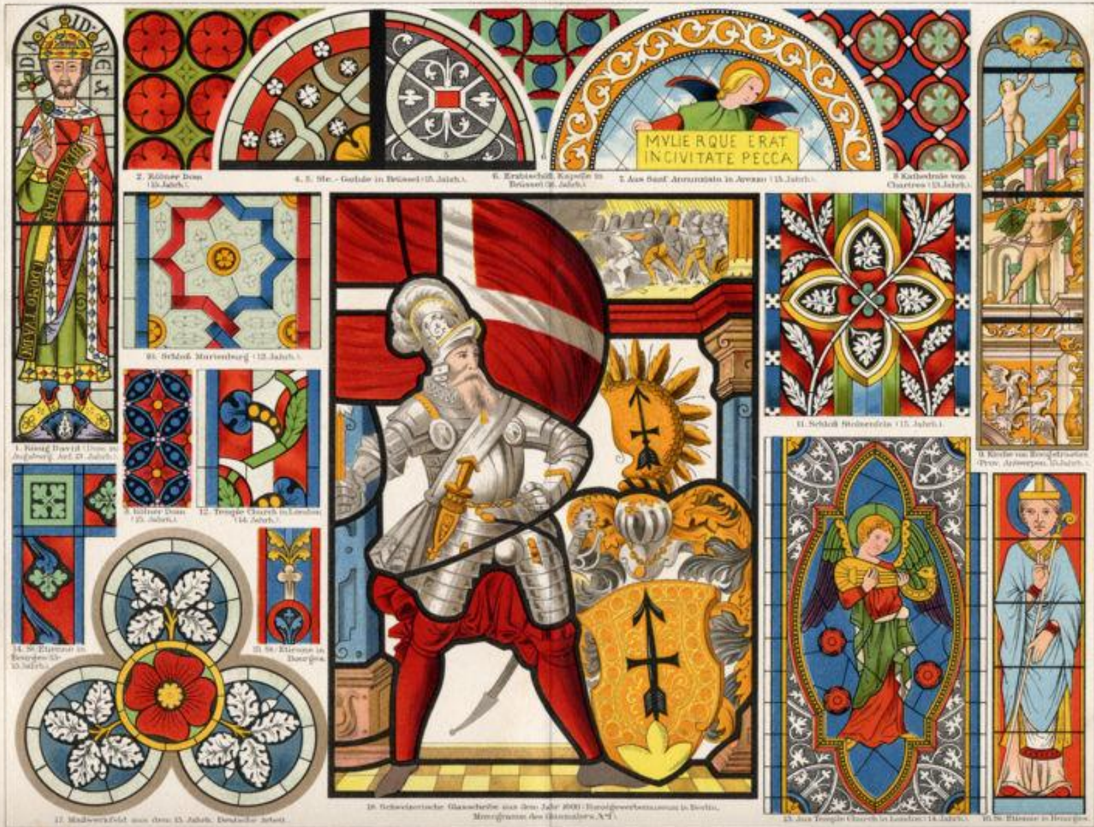
18. Schwedische Glasmalerei aus dem Jahr 1800: Hingewerbenussamen in Berlin, Merzgraben des Glasmalers A. S.