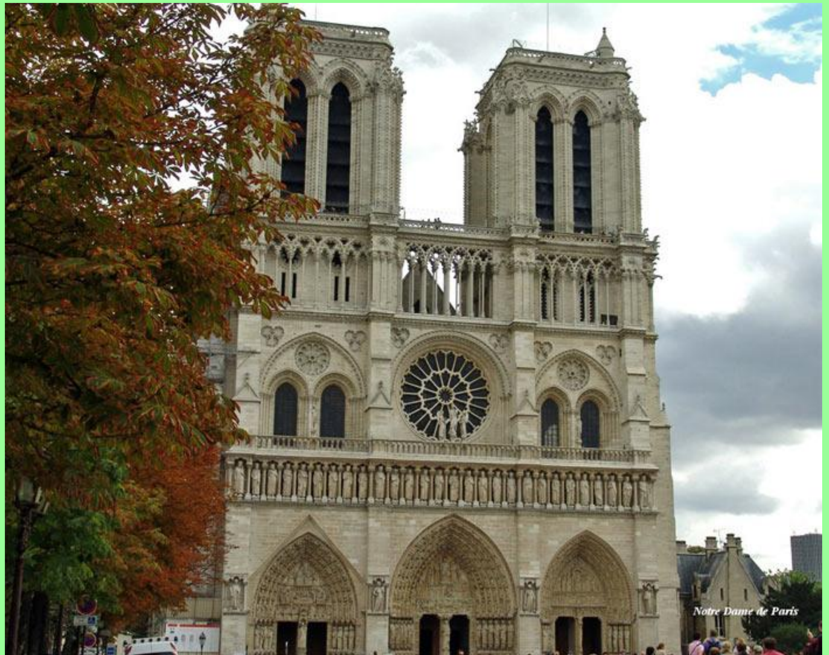
Notre Dame de Paris