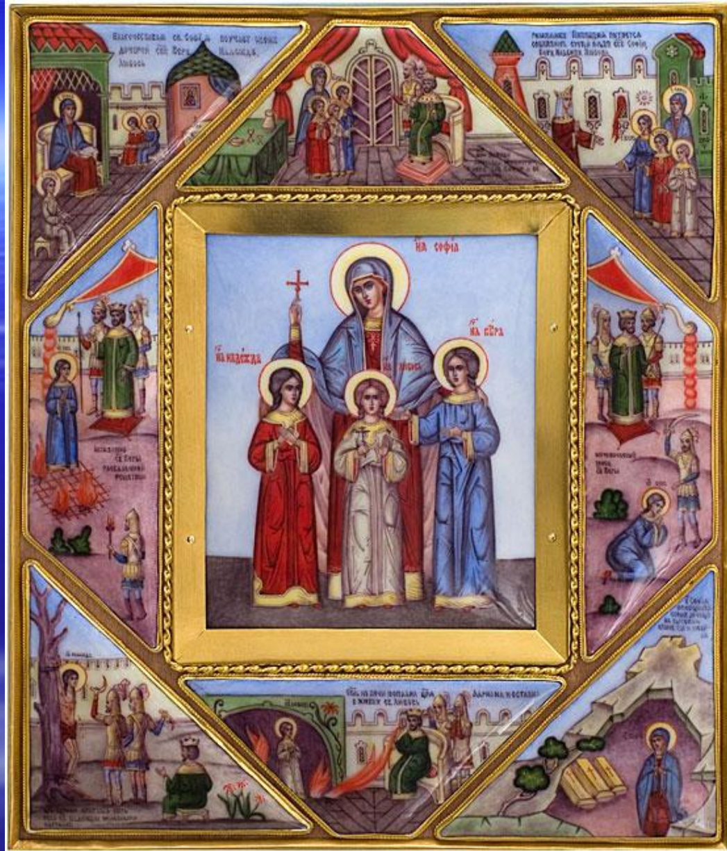
Народные обычаи и приметы в день мучениц Веры, Надежды, Любви и матери их Софии