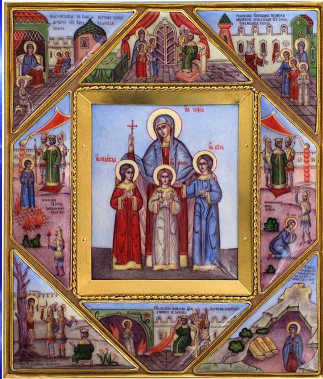
Народные обычаи и приметы в день мучениц Веры, Надежды, Любви и матери их Софии