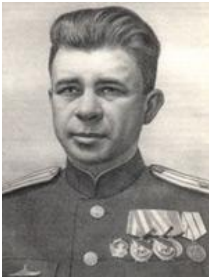
Маринеско Александр Иванович