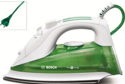
TDA7650 Oktober 2009