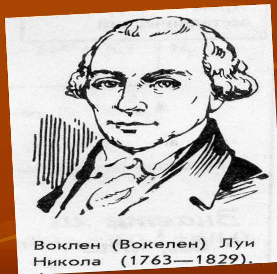
Воклен (Вокелен) Луи Никола (1763—1829).

. Название «хром» предложили друзья Воклена, но оно ему не понравилось – металл не отличался особым цветом. Однако друзьям удалось уговорить химика, ссылаясь на то, что из ярко окрашенных соединений хрома можно получать хорошие краски.