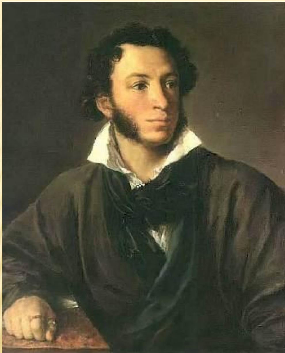
Александр Сергеевич Пушкин Портрет работы О.Кипренского