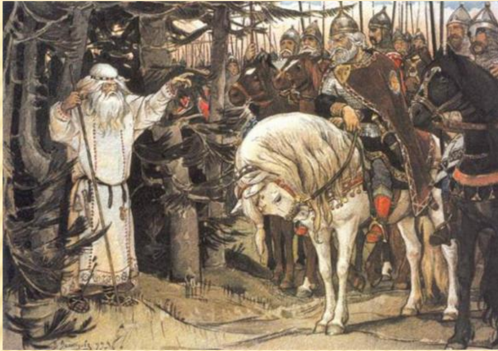
Песнь о вещем Олеге