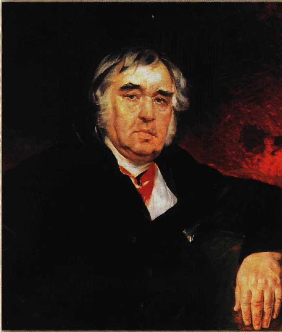
Иван Андреевич Крылов ( 1769-1844 )