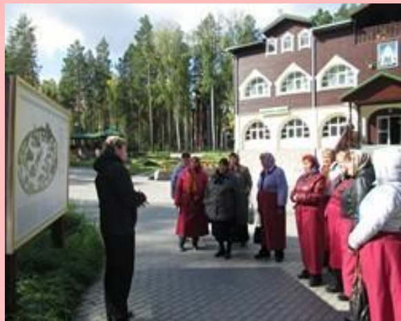
Храм на крови, Ганина Яма, 12 человек.