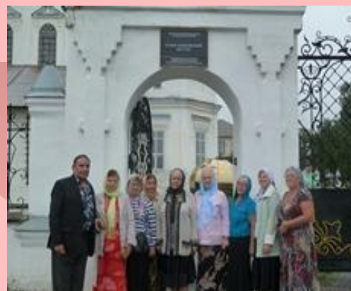
Ганина Яма • 13 человек - из села Сипавское; • 13 человек - из села Колчедан ; • 12 человек - из села Сипавское