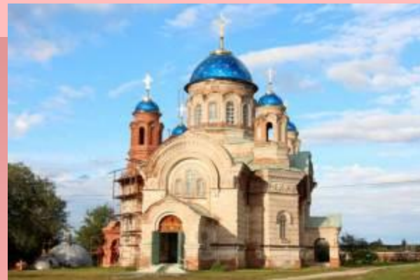
г. Верхняя Теча - граждане пенсионного возраста села Покровское, 12 человек.