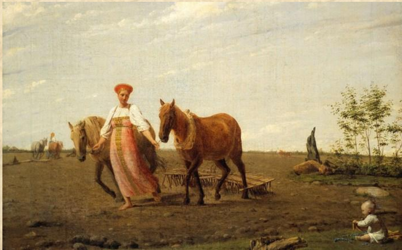
На пашне. Весна, 1820