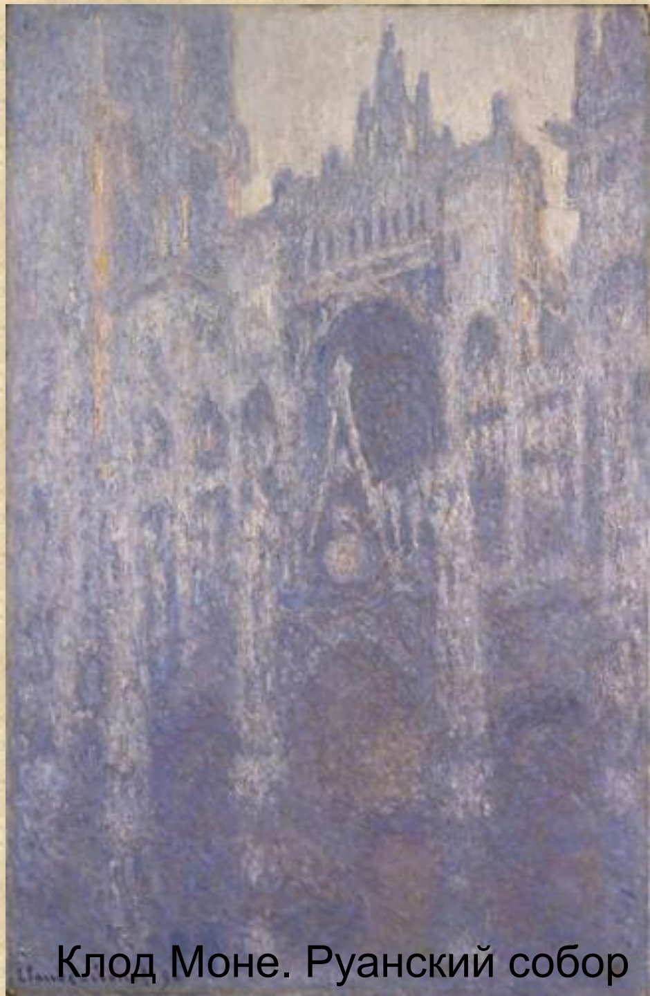
Клод Моне. Руанский собор