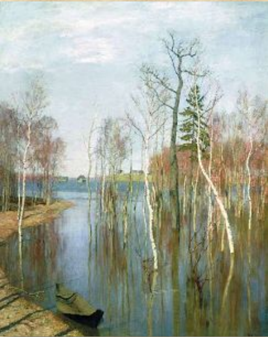
И. Левитан. Весна. Большая вода

Вот какими словами описал свои впечатления от картины знаток русской живописи М. Алпатов: