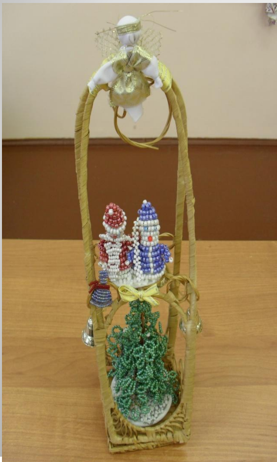
Композиция «Дед мороз и снегурочка»