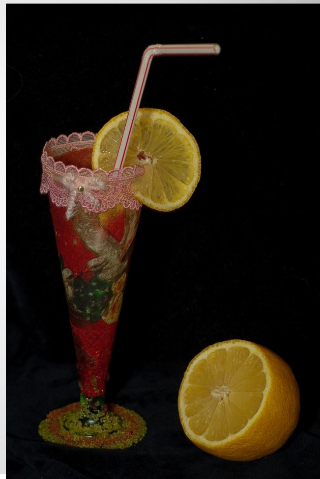
Декоративный фужер в технике декупаж