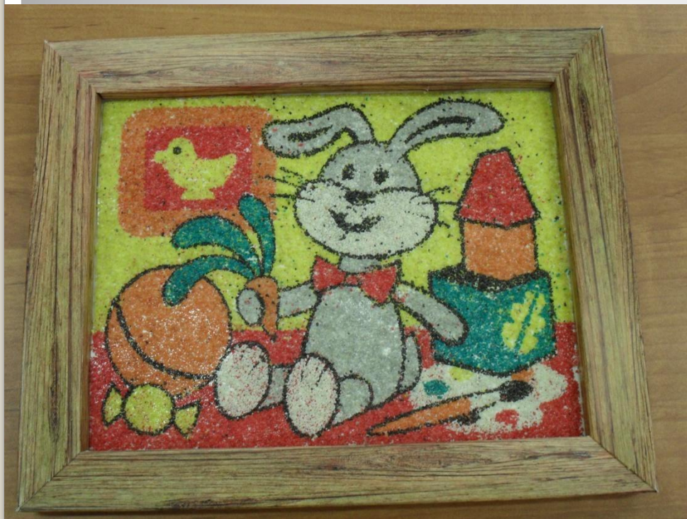
Панно «Веселый зайчик»