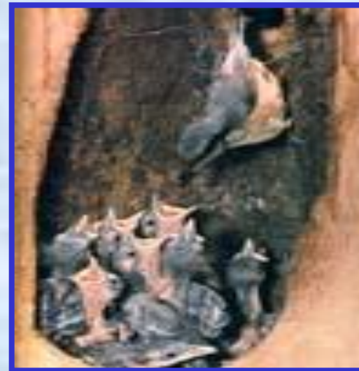
Поползень с птенцами