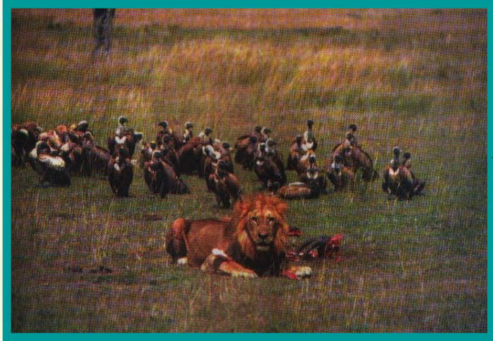
Грифы и лев