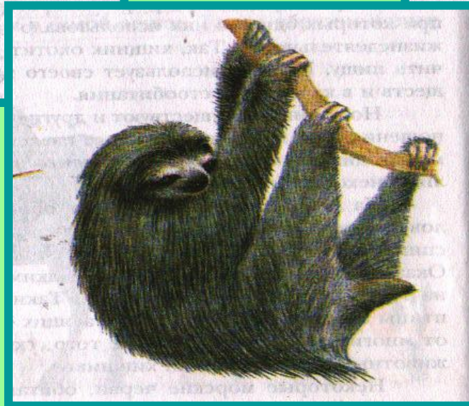
ЛЕНИВЕЦ И ЗЕЛЁНЫЕ ВОДОРОСЛИ