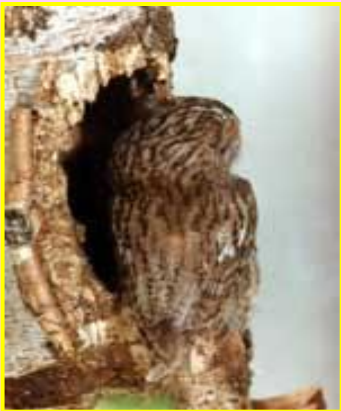
Неясыть у дупла