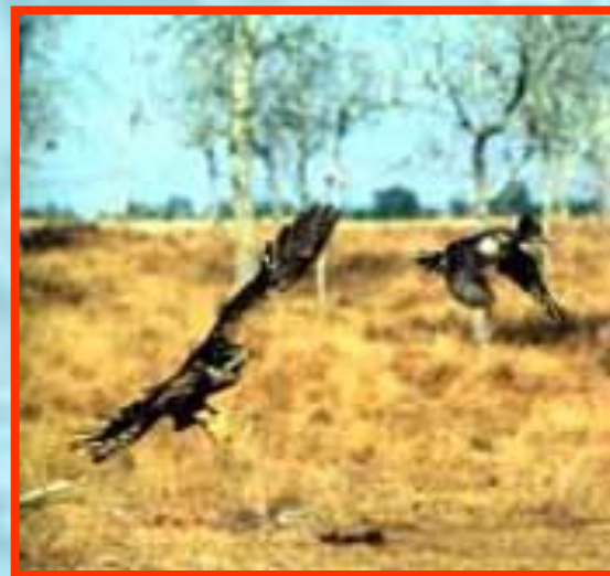
Ястреб-тетеревятник, охотящийся на крохалея