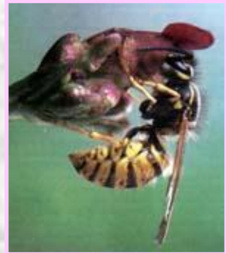
Оса на норичнике