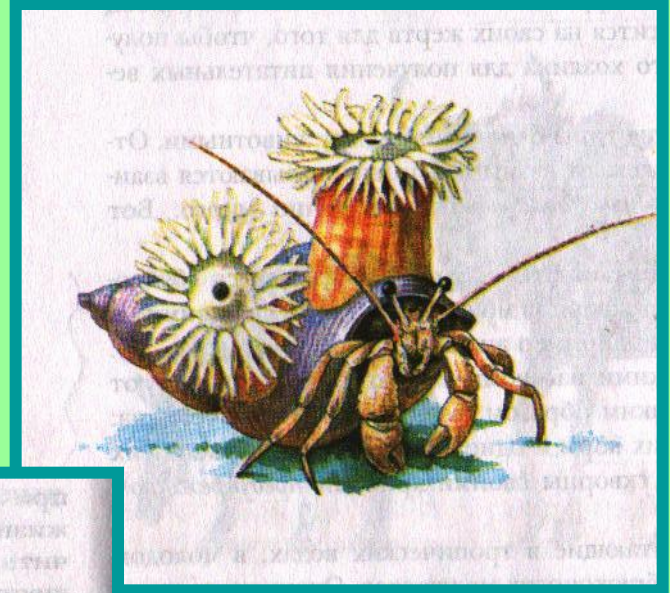
РАК-ОТШЕЛЬНИК И АКТИНИЯ