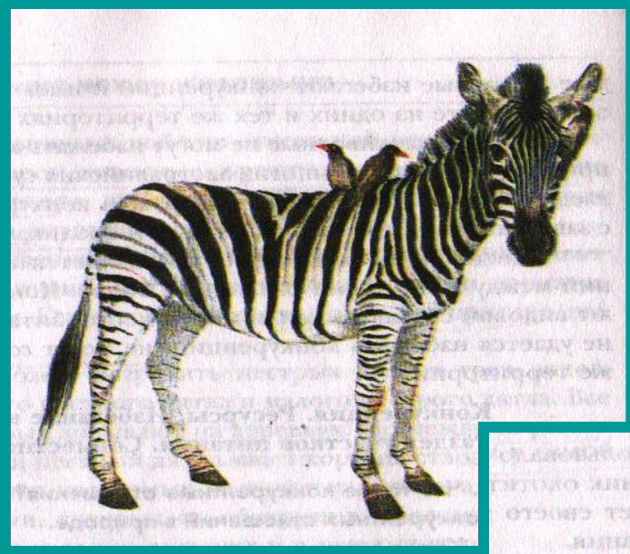
ЗЕБРА И БУЙВОЛОВ СКВОРЕЦ