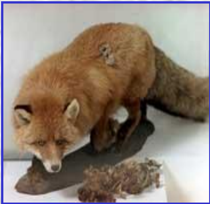
Лиса с репейником на шерсти