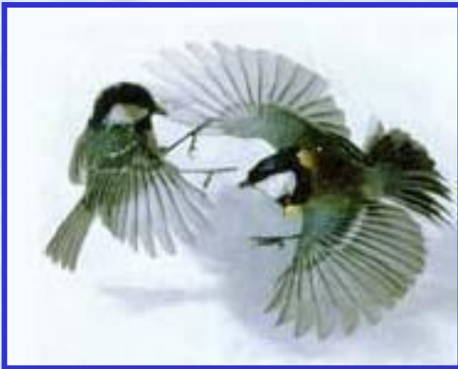
Черная и большая синицы, дерущиеся из-за корма

Кроме того, в естественной обстановке виды со сходными потребностями избегают конкуренции благодаря различиям в местообитании, суточной и сезонной активности, предпочитаемой пище.