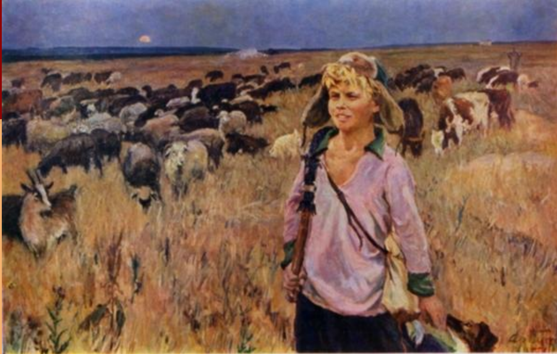
А. Пластов. Витя-подпасок