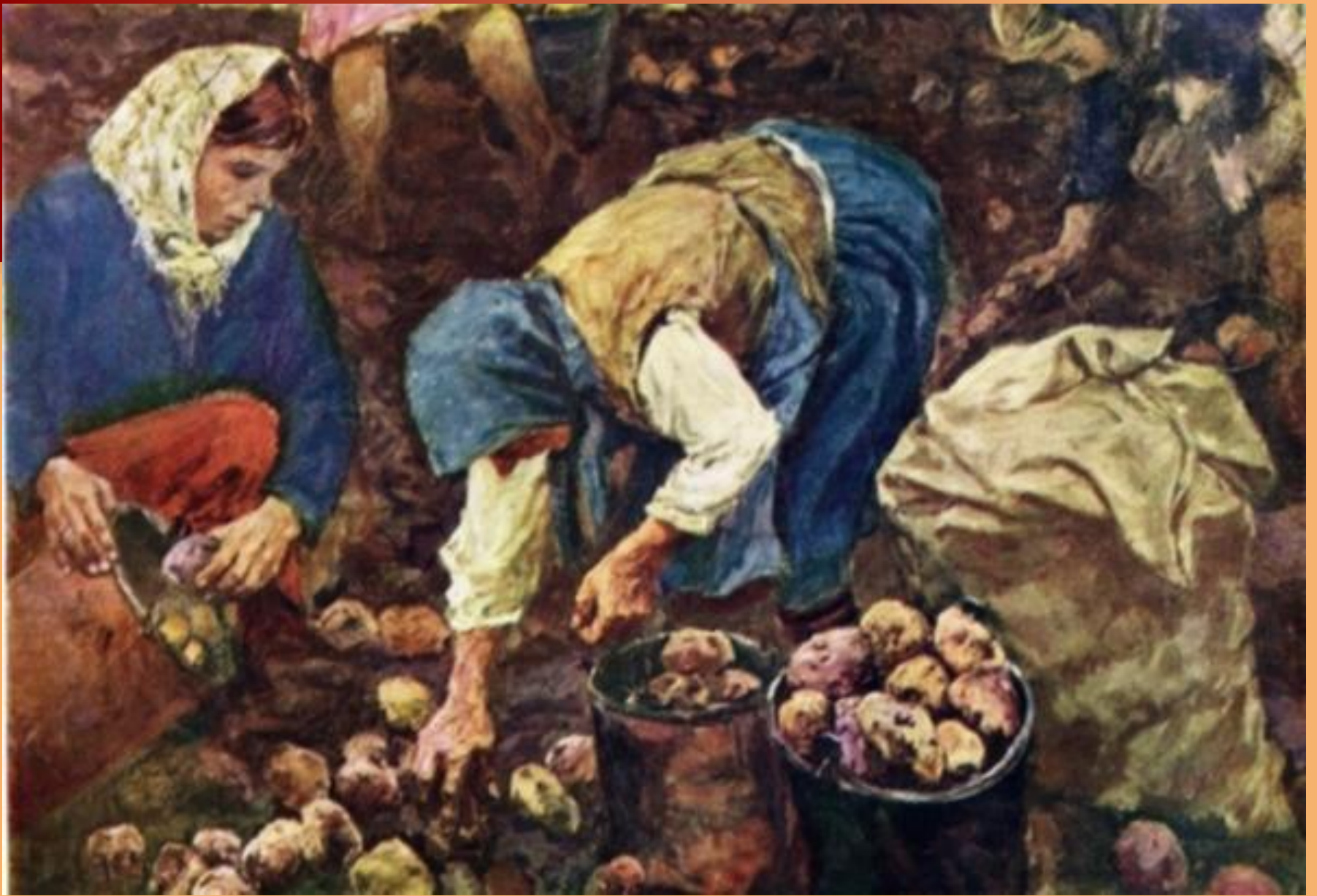
А. Пластов. Сбор картофеля