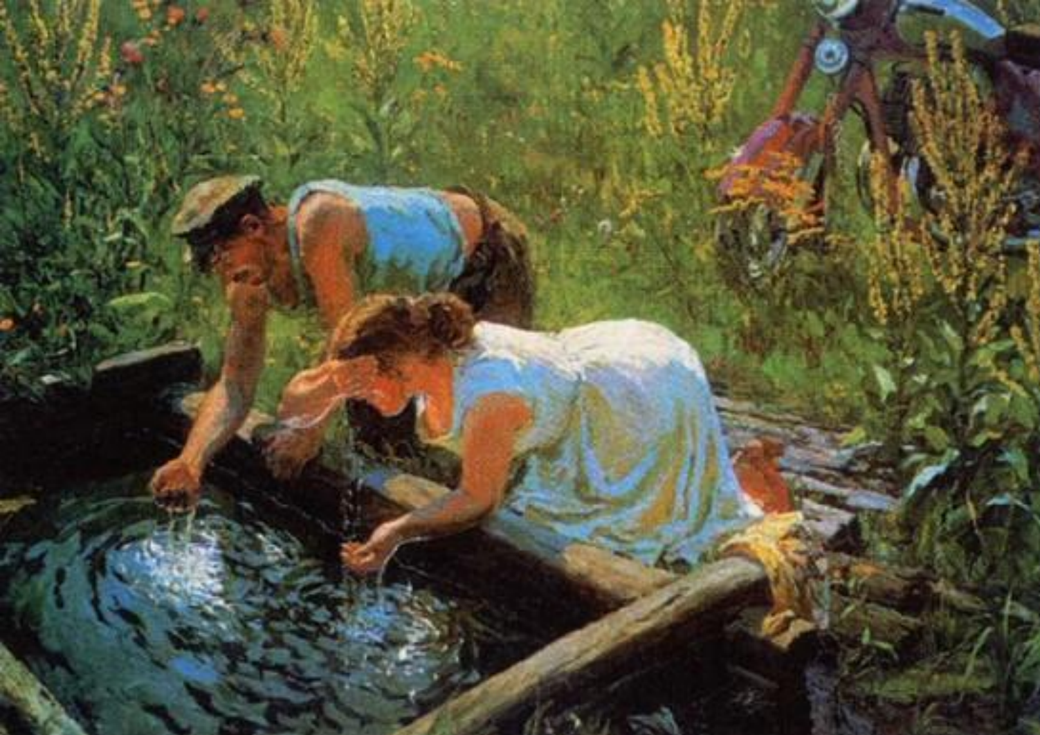
А. Пластов. Полдень

В зависимости от сюжета А.Пластов использует то буйную игру красок, цвета, и тогда всё на полотне залито солнцем, радугой красок, то пишет в сдержанном колорите. Но в любом случае его изображение – сама правда жизни.