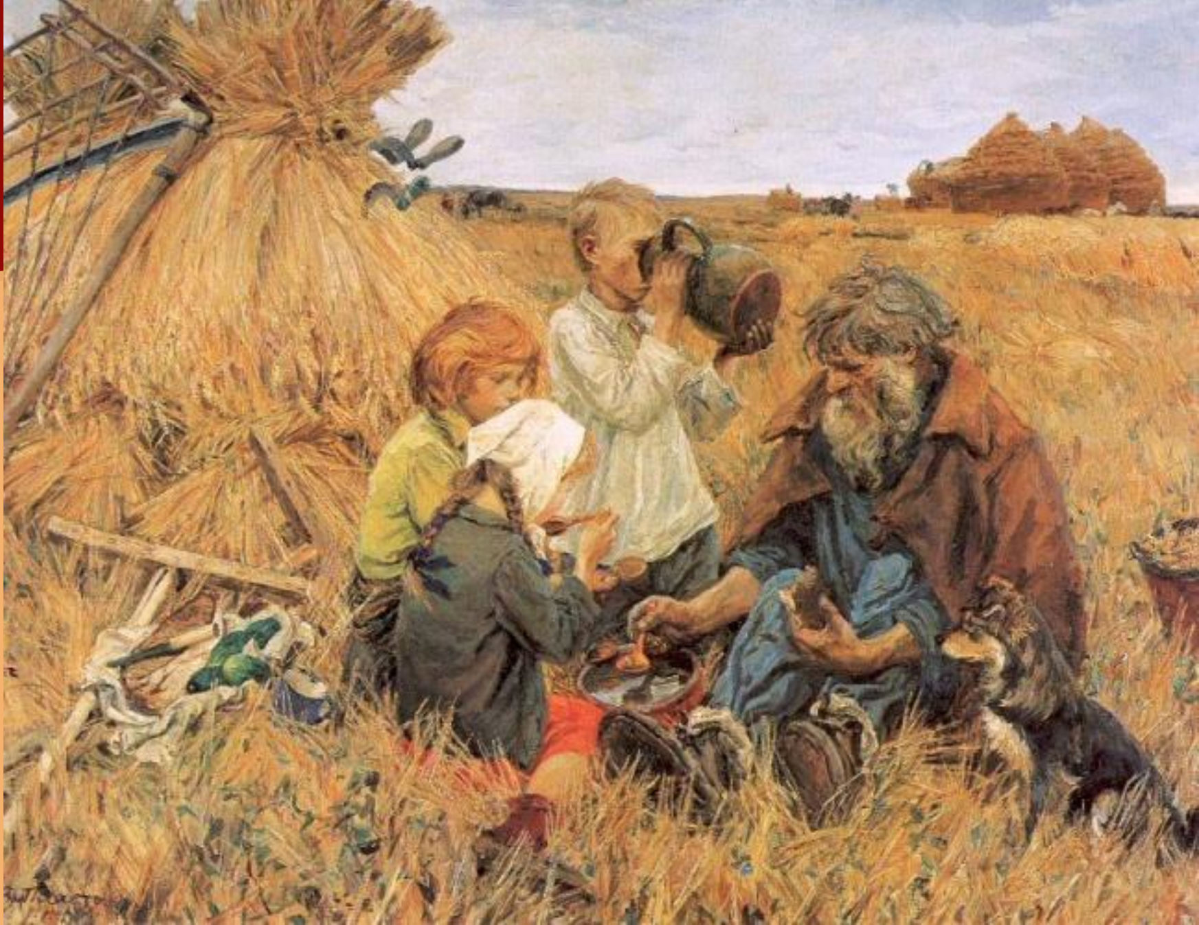
А. Пластов. Жатва