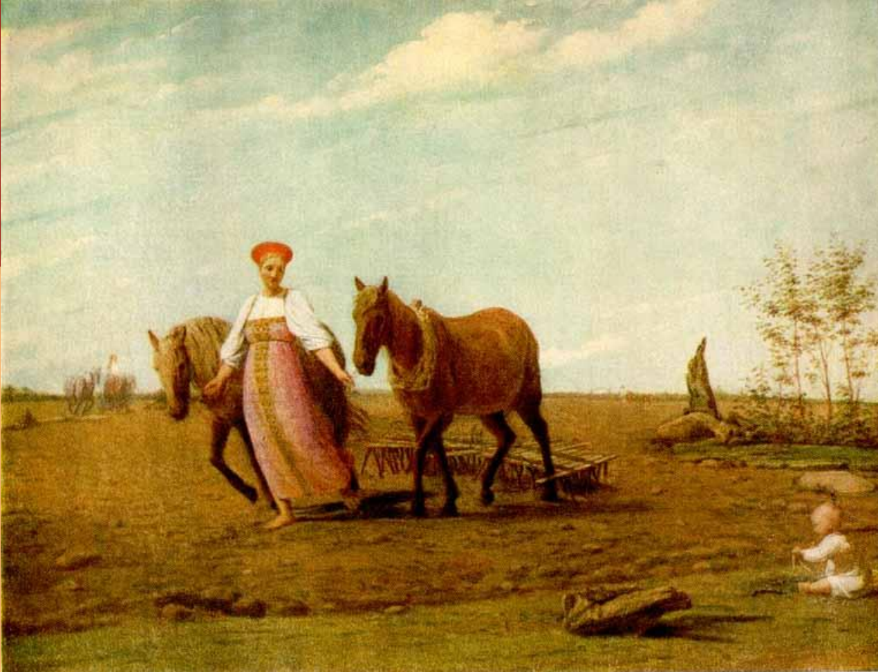
А. Венецианов. На пашне. Весна

Красотой и покоем наполнена картина. После зимнего отдыха проснулись поля, земля напиталась влагой, на деревьях зеленеет молодая весна, по небу плывут лёгкие облачка. Крестьянка, вышедшая боронить, ведёт двух золотистых лошадей. Она с нежной улыбкой смотрит на играющего ребёнка. Освещённая солнцем крестьянка в праздничном наряде сама похожа на радостно шагающую по земле весну.