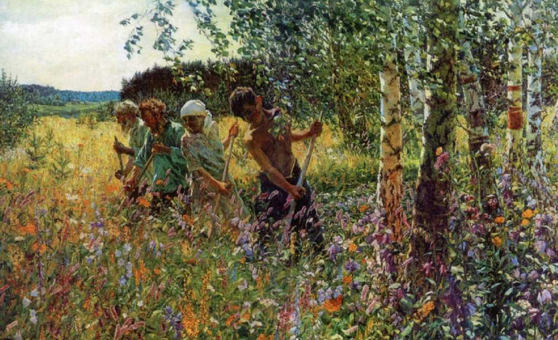
А. Пластов. Сенокос