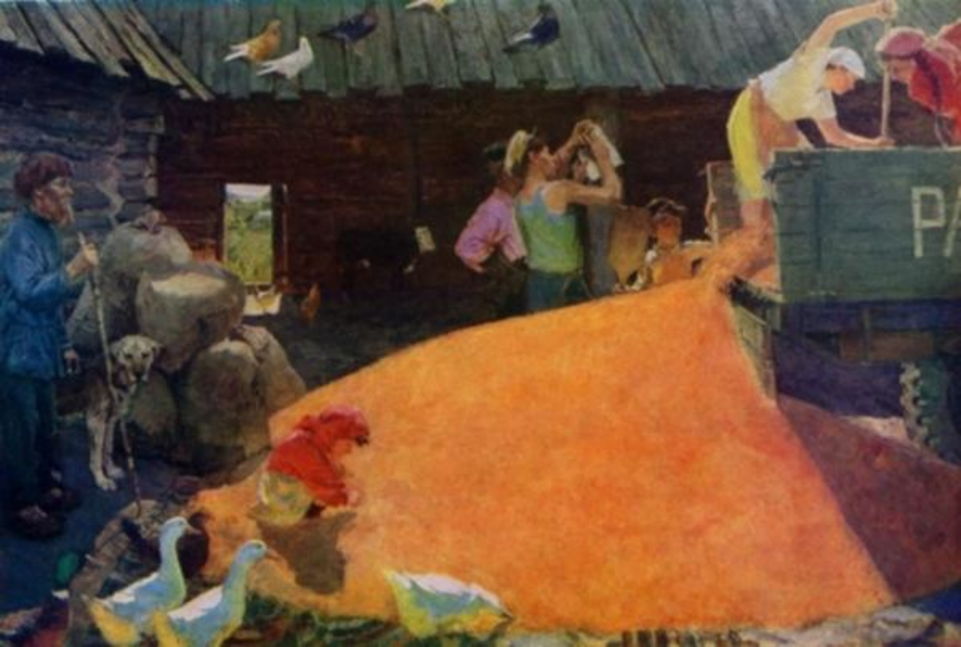
А. Пластов. Август колхозника