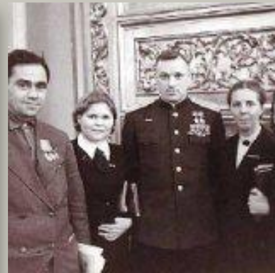
Делегаты Верховного Совета