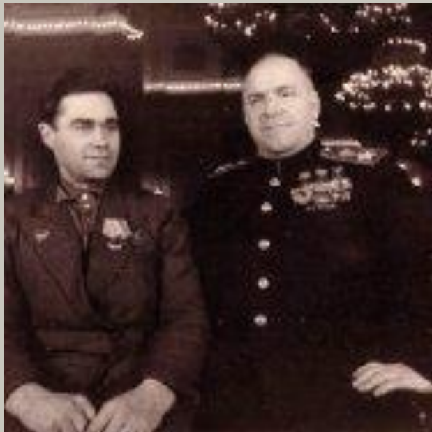
Т. С. Мальцев и Г. К. Жуков

Мальцев участвовал в девяти съездах партии, почти полвека был депутатом Верховного Совета РСФСР и СССР. Терентий Семенович умер 11 августа 1994г.