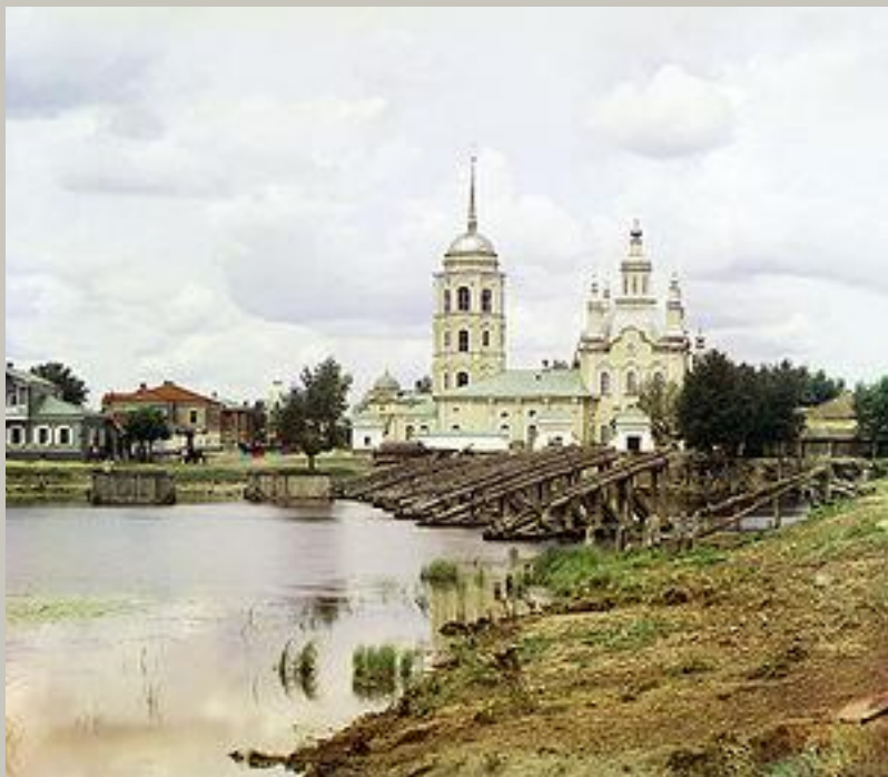
Шадринский уезд 1910г.

Родился в бедной крестьянской семье 29 октября (10 ноября) 1895 года в селе Мальцево (Шадринский уезд Термской губернии, ныне Шадринский район Курганской области).