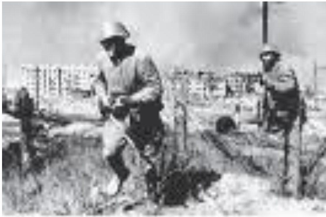
Солдаты, 1942 г.

В атаку пошла пехота- К полудню была чиста От убегающих немцев Скалистая высота.