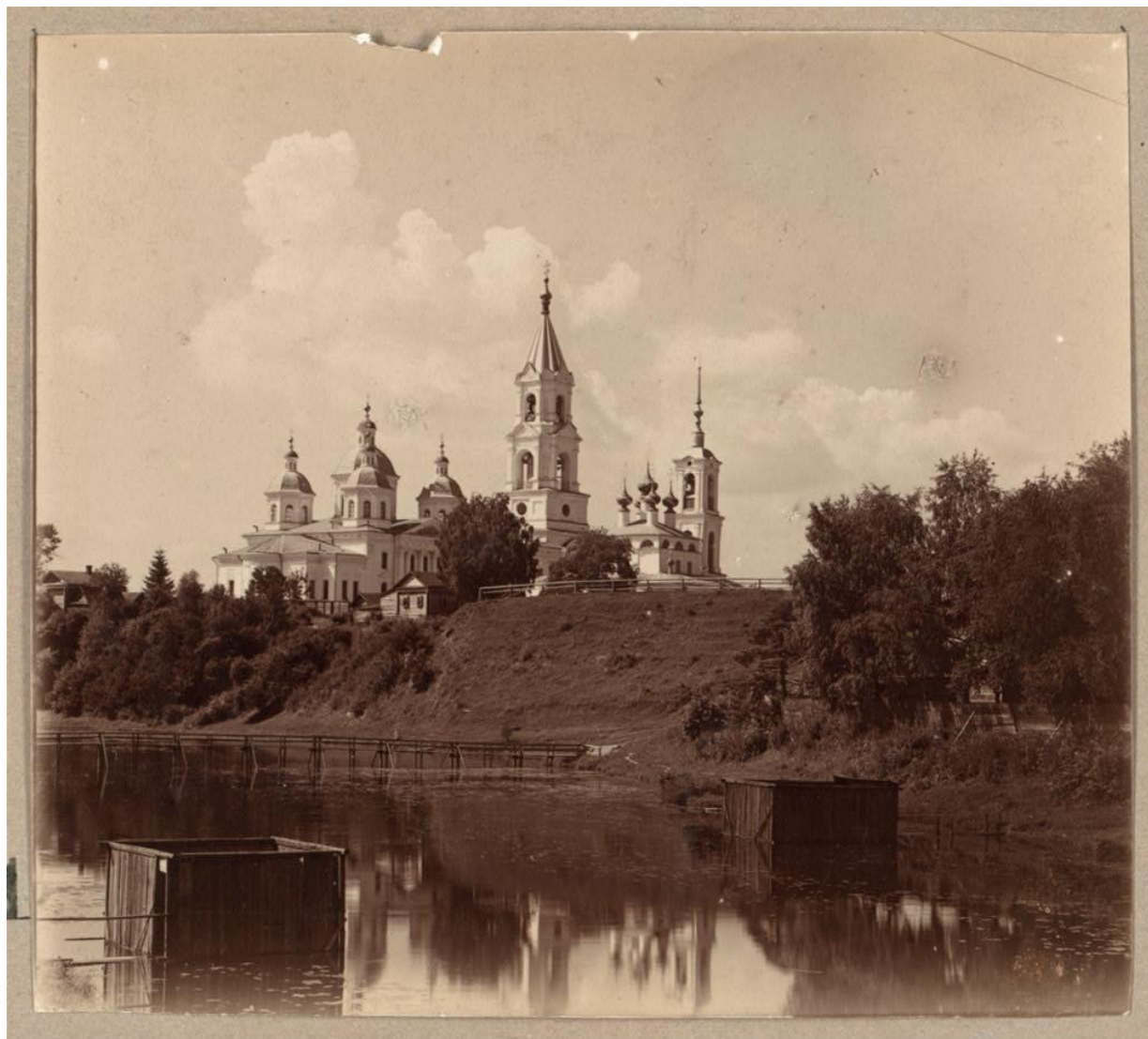
Успенский собор. Кашин.