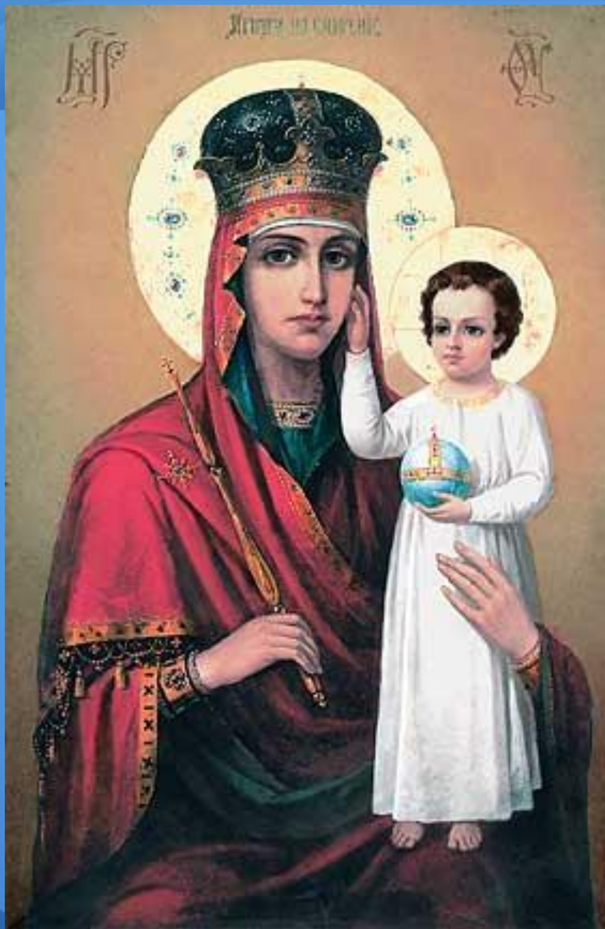
Икона Божией Матери «Призри на смирение»