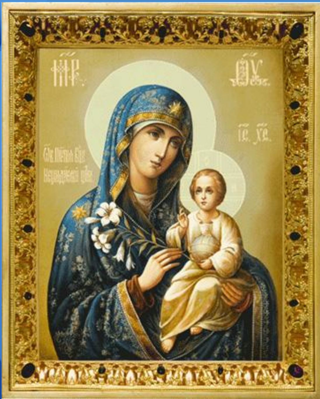
Образ Божией Матери «Неувядаемый цвет»