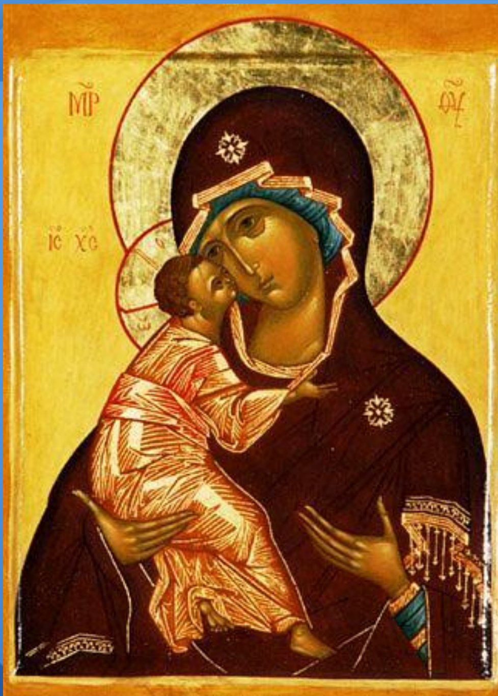
Владимирская икона Божией Матери