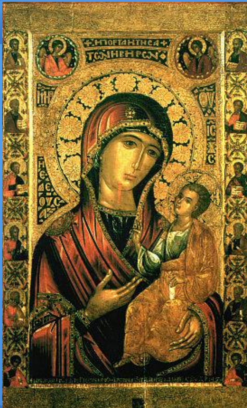
Иверская икона Божией Матери. XIX