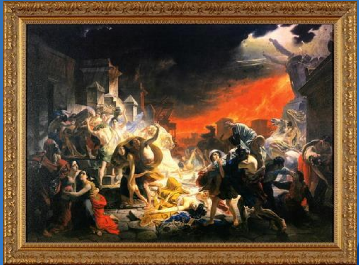
Карл Брюллов «Последний день Помпеи»