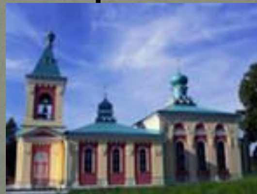
храм Преображения Господня.