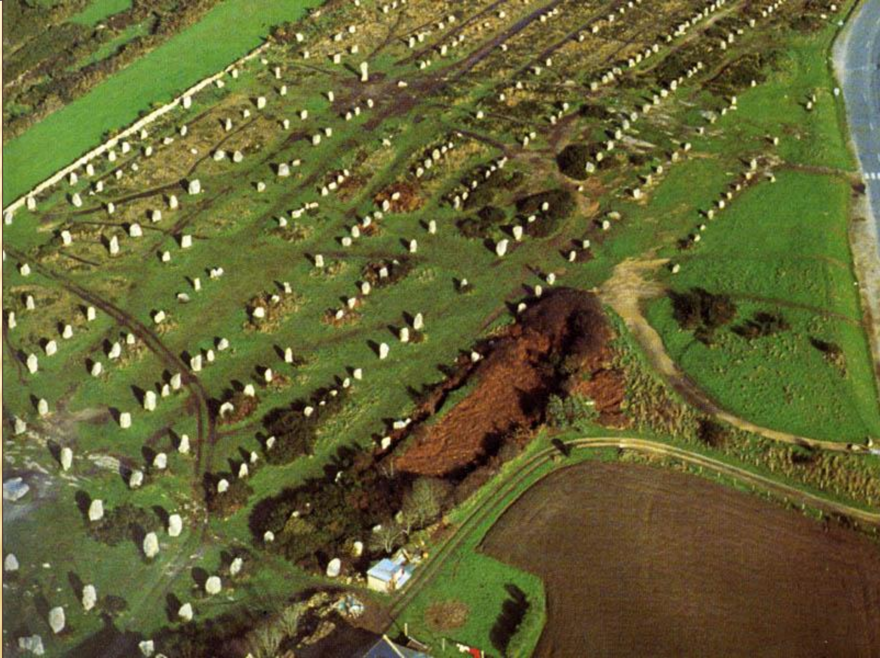
Менгиры в Карнаке. Франция