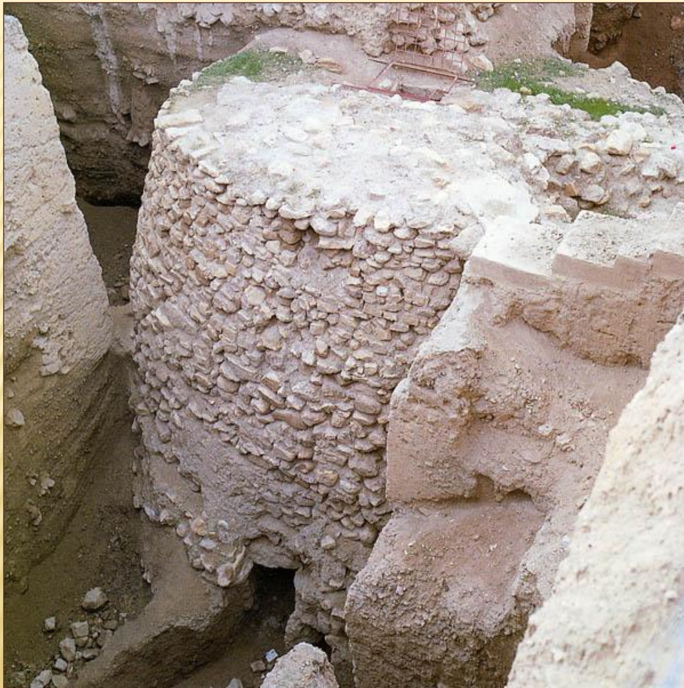
Иерихон. Поселение. Израиль.