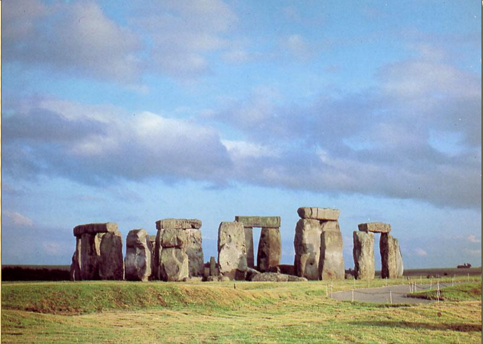
Стоунхендж. Солсбери. Великобритания.