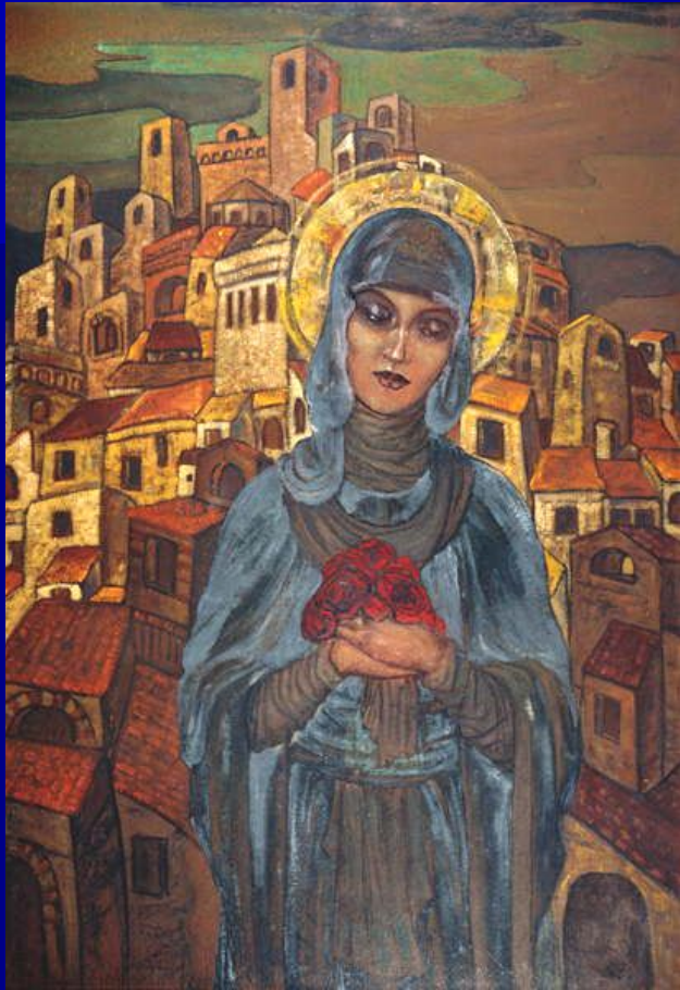
Крещение княгини Ольги

Княгиня Ольга пыталась установить добрые отношения с соседними странами и прежде всего с Византией. Она понимала, что Руси больше нельзя оставаться языческой т.к. христианские государства относятся к ней, как к «варварской», «дикой». Ольга со свитой отправилась в Константинополь и с благословения византийского императора приняла христианство и новое православное имя Елена. Она стала первой христианкой на Руси.