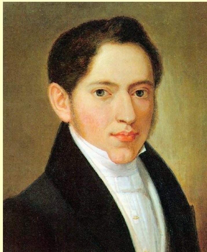
Н. П. Огарёв