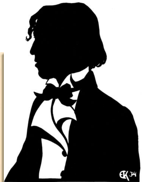
Автопортрет, Силуэт, 1934. Е.С. Кругликова