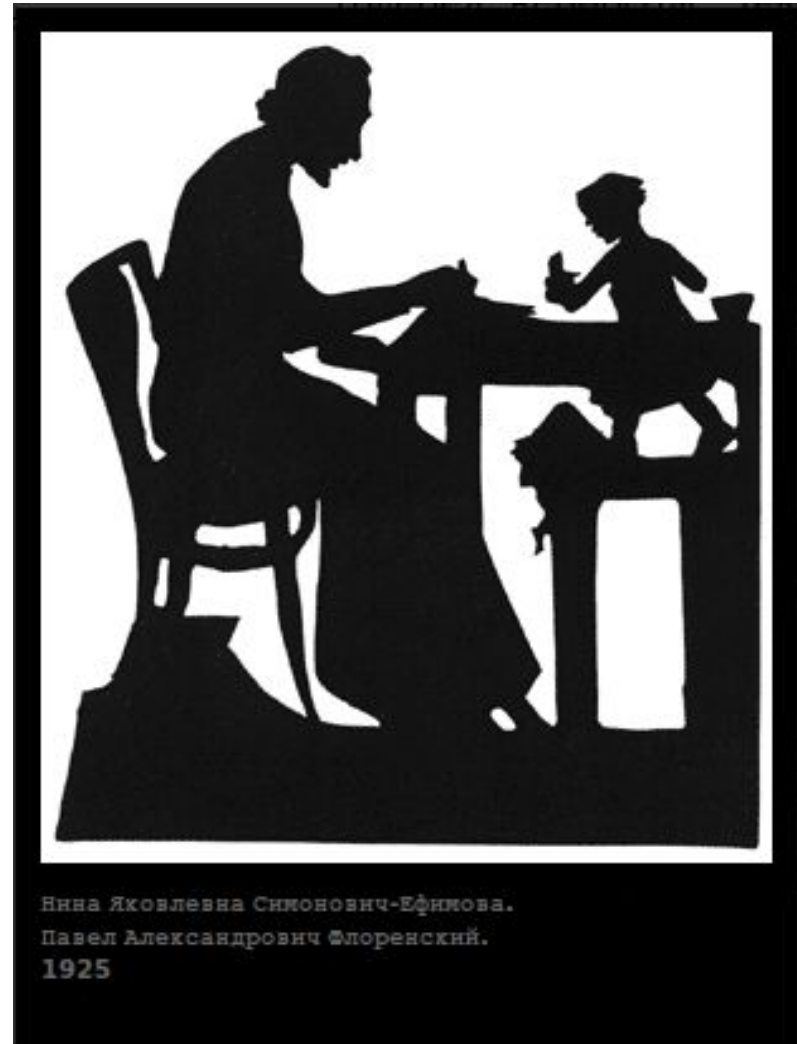
Инна Яковлевна Симонович-Ефимова. Павел Александрович Флоренский. 1925