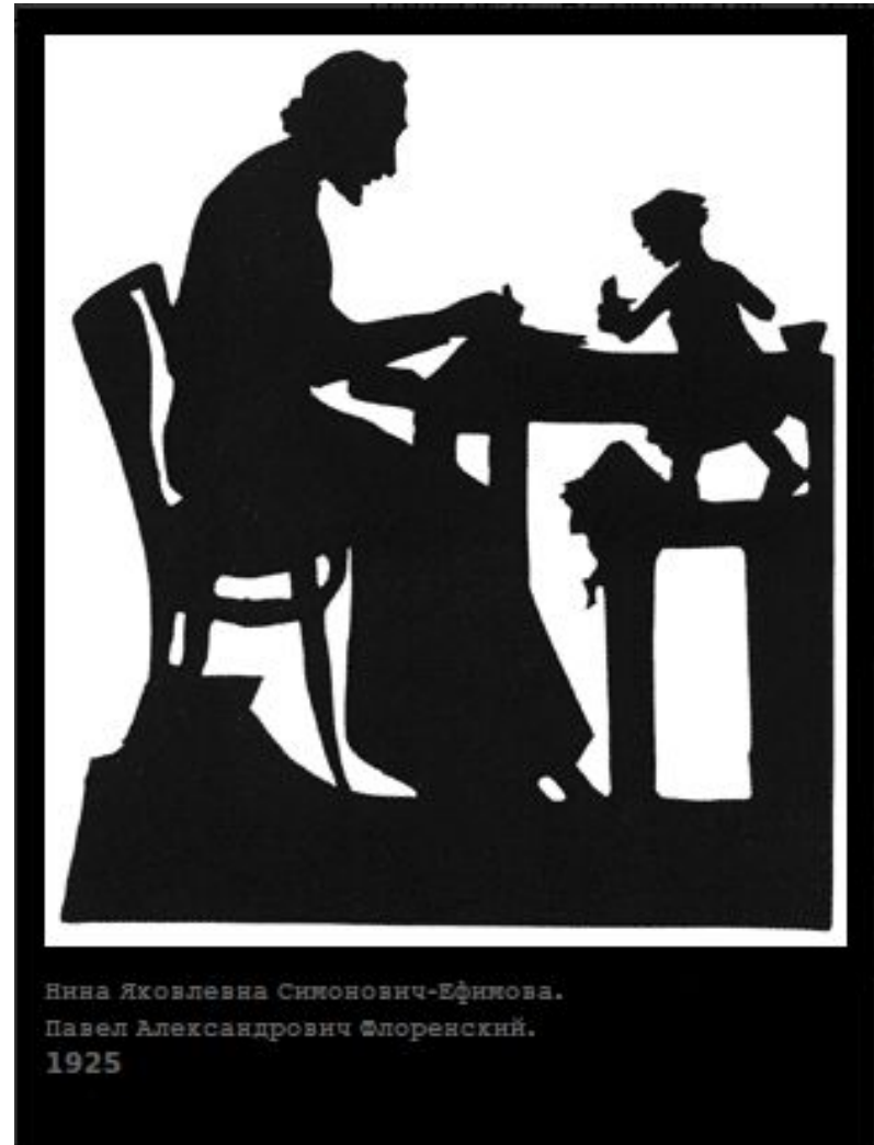
Нина Яковлевна Симонович-Ефимова. Павел Александрович Флоренский. 1925