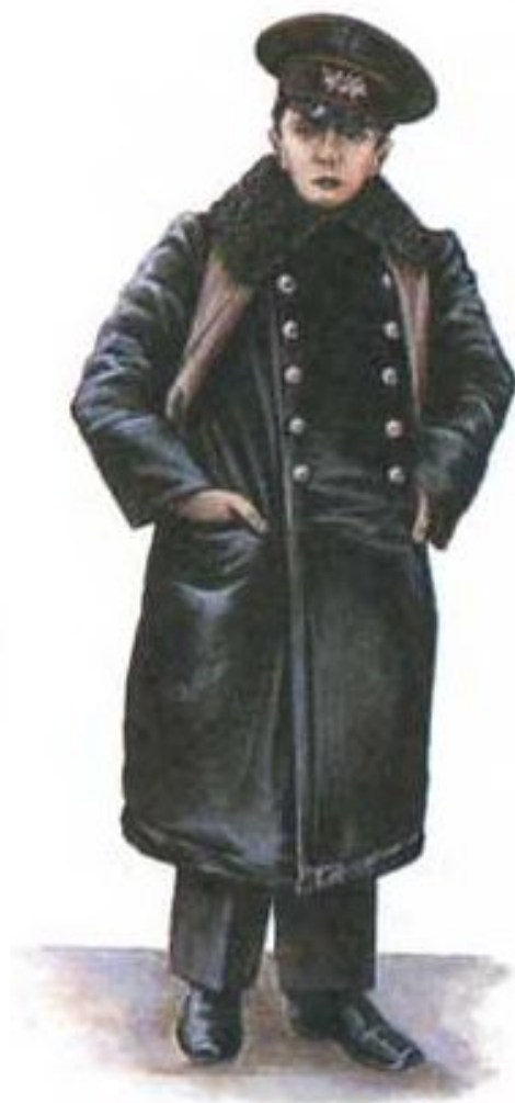
Ученик реального училища. Конец XIX в.