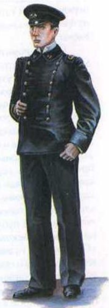
Студент Горного института. 1882 г.