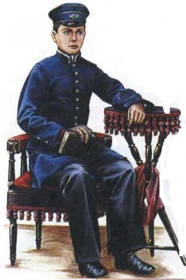
Гимназист. Конец XIX в.