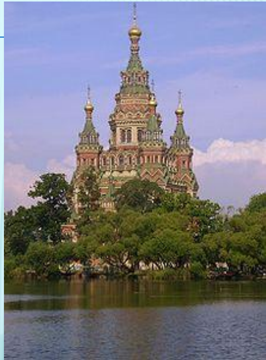
Собор Петра и Павла в Петергофе

распространённого на Руси с древности до настоящего времени. «Летописец вкратце Русской земли» под 1532 годом говорит: «Князь великий Василей постави церковь камену Взнесение Господа нашего Исуса Христа вверх на деревяное дело». Это летописное сообщение прямо связывает происхождение шатра с деревянным зодчеством. Выше приводились доказательства раннего происхождения деревянных шатровых храмов и их распространённости. Но если в деревянных церквях шатёр вынужденно сменил купол по конструктивным причинам, то замена купола шатром в каменном строительстве не связана с проблемой конструкции. Причину возникновения каменных шатров следует видеть в желании придать храму определённый образ. С. В. Заграевский отмечает, что и в Москве, и тем более в провинции вытянутые силуэты деревянных шатровых церквей играли ведущую роль.