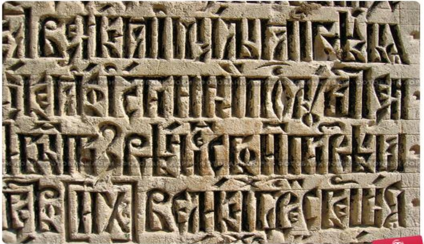
Рельефная надпись на церковнославянском языке (Новый Иерусалим, Москва)

Церковнославянский язык с самого начала являлся (и до сих пор является) языком православного богослужения; долгое время он занимал доминирующее положение в письменной сфере в целом.