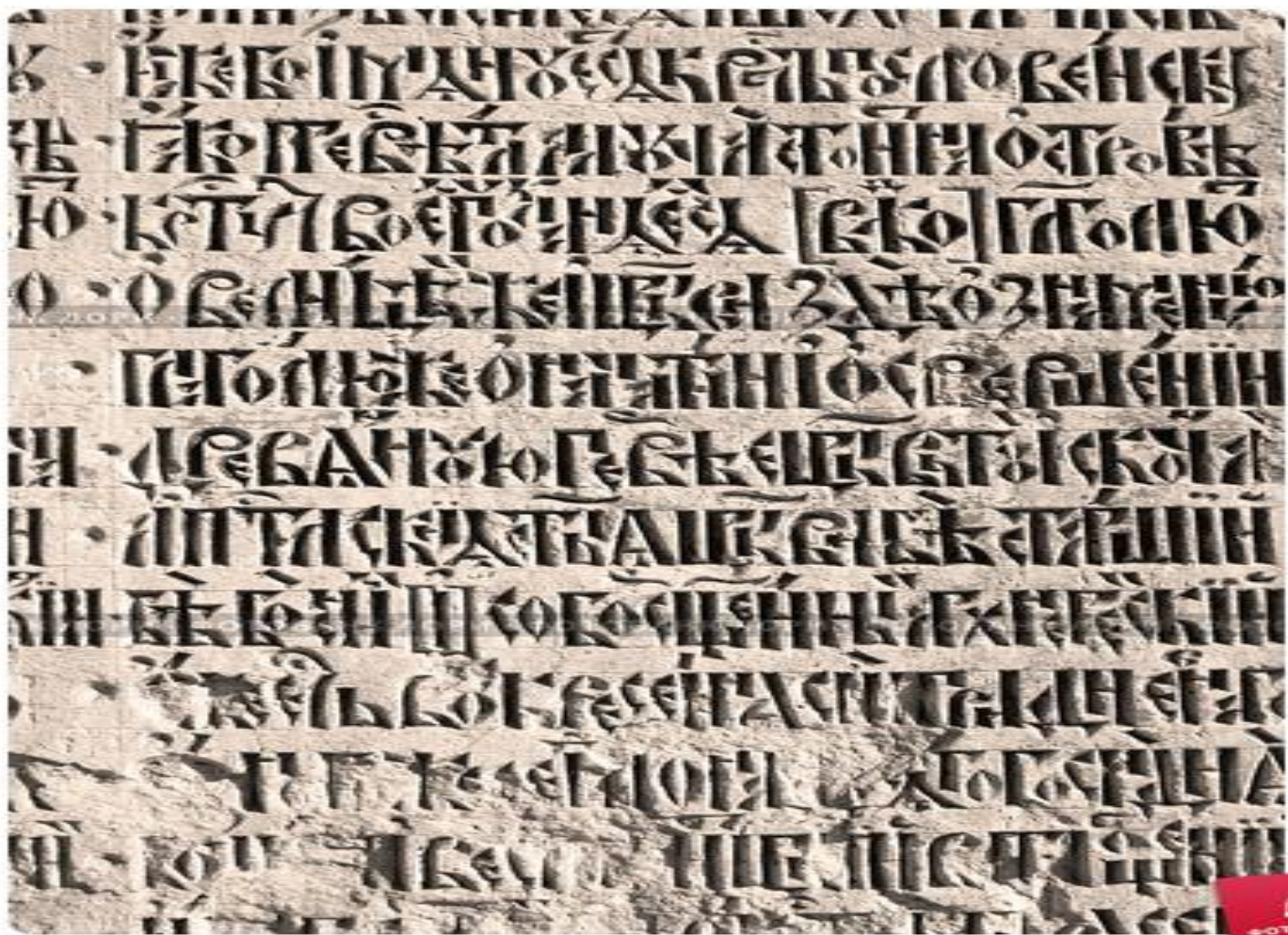
Истра. Надпись на старославянском языке на стене голгофского придела Ново...