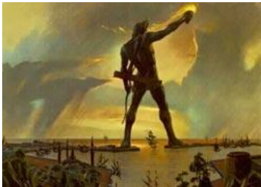
□ Колосс Радосский