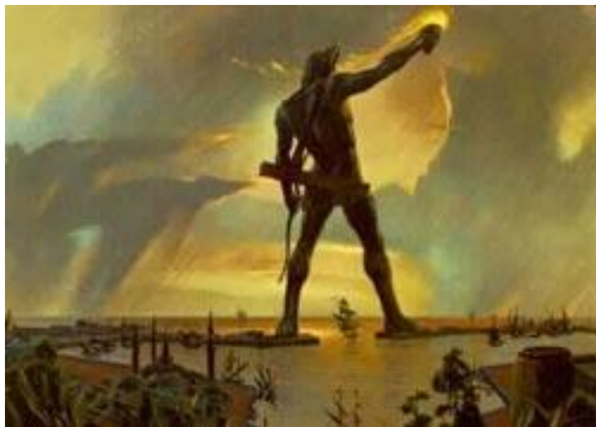
□ Колосс Родосский