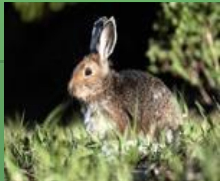
Заяц - русак